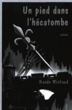
NANDO MICHAUD Un pied dans l'hécatombe roman, 241 p., 18 $

Dominique écrit à son amie Margot après des années de silence. Très vite, une certaine fin d'après-midi est évoquée par des sous-entendus de plus en plus accusateurs. Une fin d'après-midi dramatique où, au début de leur adolescence, dans le sentier qu'elles empruntaient pour revenir de l'école, leur amie Crabe a été retrouvée étranglée... Qui l'a tuée ? Doudou le sait. Margot aussi.