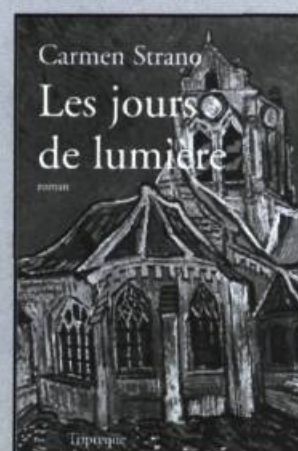
CARMEN STRANO Les jours de lumière roman, 248 p., 18 $

Roman de la précarité financière et sentimentale porté par un ton doux-amer et un rythme enveloppant, Itinérances nous entraîne dans l'histoire d'un jeune couple qui, surnageant en toute lucidité entre un présent insatisfaisant et un avenir qui n'offre que peu d'issues, refuse de baisser les bras.