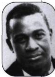
Joël Des Rosiers

L'unité du livre de Acquelin est donc extrêmement fragile parce que toujours en porte-à-faux au-dessus soit d'une thématique d'une relative limpidité, soit d'une autre plus éclatée. D'une part, on trouve parfois des vers qui bouleversent : « j'ai vu le bleu très sûr des yeux fermés / d'un enfant s'abandonnant à la bague de la mort » (« J'aime ce qui ne fut jamais », p. 57) ; ou encore de fulgurantes pensées : « l'homme n'aura été qu'un court malheur » (« Le septième doigt », p. 47 ; le titre de ma critique est d'ailleurs l'un de ses vers). Mais, d'autre part, on trouve aussi un Acquelin qui veut « alambiquer » (je souligne) : « laisse te devancer ce qui déjà en toi te dépasse / l'air déverrouille ton être à la lumière qui descend / tu voudrais mourir à chaque beauté rencontrée / afin que ta mort se taise devant tant de vie / mais ce n'est seulement que par le contraste / de ce que tu n'es pas que tu peux voir / la splendeur. » (« idem », p. 50) Ouin ! Bon, passons ! Mais c'est tout Acquelin cela, du pire comme du meilleur. Et par chance, ce dont le lecteur se souvient toujours, c'est du meilleur chez lui, car c'est un poète d'une grande force, d'une grande sensibilité. La profondeur de la vision qu'il propose est souvent intense et vive. Ce poète Acquelin donnera un jour le livre unifié qu'on est en droit d'attendre du talent intrinsèque dont témoignent tant de ses textes.