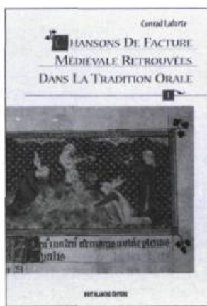
CHANSONS DE FACTURE MÉDIÉVALE RETROUVÉES DANS LA TRADITION ORALE Tomes I et II (sous coffret) Conrad Laforte 955 pages 75 $