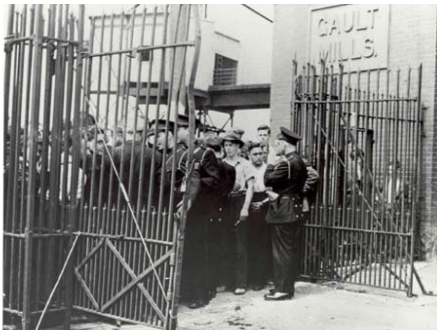
Policiers et piqueteurs, Moulins Gault, Salaberry-de-Valleyfield, 1946.