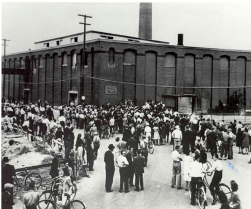
Grève, la compagnie Montreal Cottons, Salaberry-de-Valleyfield, 1946.