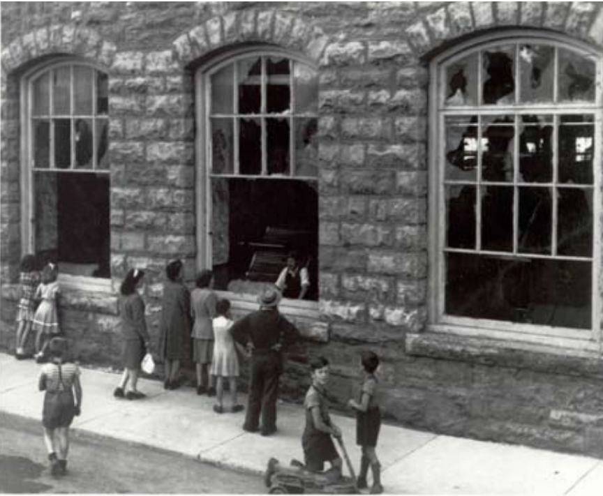
Dommages fait durant l'émeute, Grève à la compagnie Montreal Cottons, Salaberry-de-Valleyfield, Août 1946.