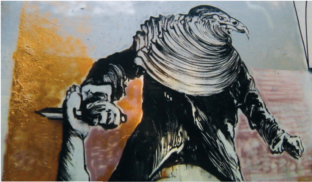
Graffiti à Exárcheia, Athènes. Photogramme du film Combat au bout de la nuit

pour respirer, peut-être aussi. Mais il y a quelque chose d'étrange ici, c'est vrai. Par exemple, le 375 e de Montréal, les 150 ans du Canada, ça veut dire quoi ? Voyez, moi, j'ai des trous énormes dans mes connaissances de l'histoire du Québec et du Canada, et je cherche à combler ces trous-là, or j'ai du mal à trouver le contenu, l'information, et puis il se passe quoi ? Rien, on dirait. N'importe où ailleurs, quand on fête des événements comme ça, c'est explosif, et ça s'exprime d'une façon très poétique et créative, dans la joie. J'ai fini par trouver des choses sur le 375 e , mais on dirait que ça a été accaparé par un groupe, tant l'aspect créatif que la signification de ce moment historique. Moi, je dis : ça ne va pas.