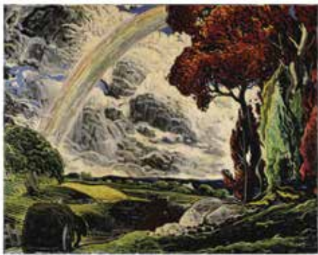
Marc-Aurèle Fortin, L'Arche-ciel, 1934 ou 1935 © Fondation Marc-Aurèle Fortin / SOCAN (2000)