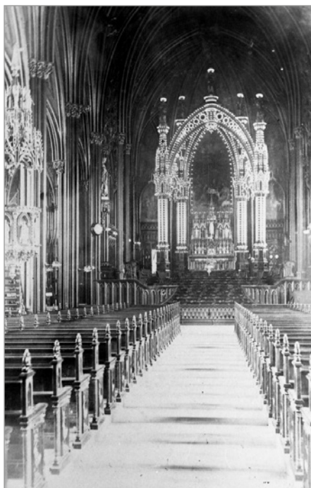
ILL. 3. VUE INTÉRIEURE DE L'ÉGLISE DE LA NATIVITÉ DE NOTRE-DAME, BEAUPORT, V. 1912.