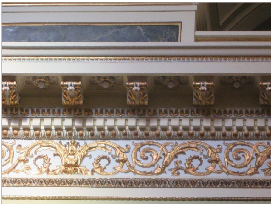
ILL. 5. CORNICHE DE LA NEF DE LA BASILIQUE-CATHÉDRALE NOTRE-DAME-DE-QUÉBEC. | AGUEDA ITURBE-KENNEDY, 2019.

des intérieurs de ces églises entre la fin du dix-neuvième siècle et la Seconde Guerre mondiale. Néanmoins, plusieurs membres du clergé apparaissent comme des protagonistes très actifs de l'entrée des éclairages électriques dans les églises, et même plus largement de l'arrivée de l'électricité dans la ville de Québec. Les nécrologies et les biographies posthumes des curés ne manquent pas par ailleurs de souligner leur contribution à l'électrification des églises, et témoignent de l'importance qu'avaient ces initiatives jusque dans les premières décennies du vingtième siècle 16 . Par ailleurs, tout au long du dix-neuvième siècle, les publications et les cours publics du Séminaire de Québec attestent de l'intérêt de cette communauté envers les innovations techniques.