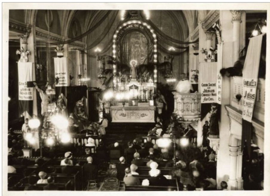
ILL. 4. VUE INTÉRIEURE DE L'ÉGLISE NOTRE-DAME-DE-LA-GARDE LORS D'UNE CÉRÉMONIE RELIGIEUSE, V. 1925.

Les églises ne sont pas en reste pour cette occasion. À Notre-Dame de Québec, un long ruban de lumières multicolores longe la basilique et son presbytère du côté de la rue de Buade. L'éclairage de la façade de la basilique « arrache un cri d'admiration à tous », tandis qu'à travers le portail ouvert « l'intérieur présente un coup d'œil unique », l'église ayant reçu quelques mois auparavant de nouveaux lustres fonctionnant au gaz et à l'électricité.