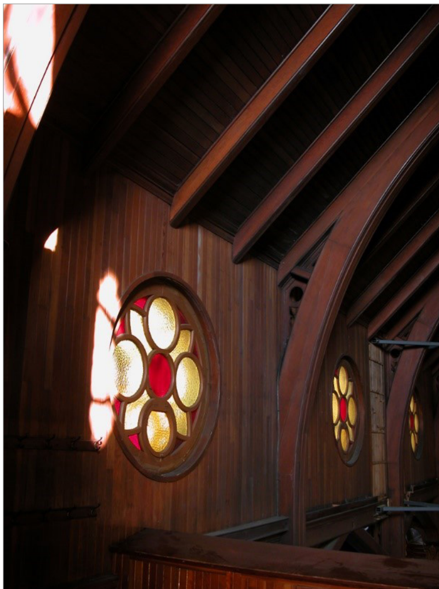
ILL. 7. VITRAIL DE L'ÉGLISE NOTRE-DAME-DE-GRÂCE, QUÉBEC. | MARC GRIGNON, 2009.

Dans la seconde moitié du dix-neuvième siècle, l'atmosphère intérieure des lieux de culte est aussi modifiée par les choix des coloris des vitraux. Alors même que la lumière artificielle fait son entrée dans les églises de Québec, le vitrail se répand dans les lieux de culte de la ville, modifiant l'aspect de la lumière naturelle qui pénètre dans la nef et le chœur. Dès les années 1860, plusieurs églises acquièrent des vitraux à la pièce, mais ce n'est qu'avec la reconstruction de l'église Saint-Jean-Baptiste et celle de la chapelle du Séminaire de Québec que le vitrail investit la totalité des baies de l'église pour offrir des tableaux bibliques. L'arrivée des éclairages électriques rend moins nécessaire l'éclairage naturel entrant par les baies pour assurer une bonne visibilité dans l'église. La généralisation du vitrail dans