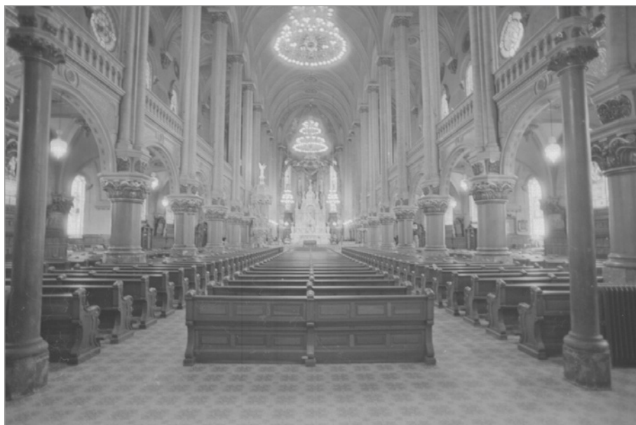
ILL. 2. INTÉRIEUR DE L'ÉGLISE SAINT-JEAN-BAPTISTE, QUÉBEC, 1985.

L'éclairage public au gaz arrive à Québec en 1849. Immédiatement, le Séminaire de Québec fait poser des becs d'éclairage au gaz dans les espaces d'enseignement, dans la chapelle et dans les lieux de vie des prêtres. Le journal étudiant du Séminaire juge l'innovation particulièrement profitable aux activités d'enseignement et d'étude des pensionnaires, tout en remarquant que le seul inconvénient est l'odeur provoquée par la combustion du gaz 3 .