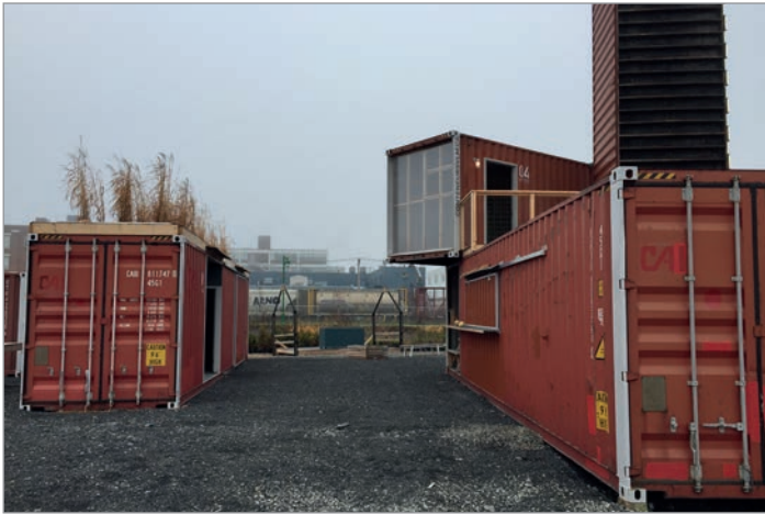
ILL. 11. LE CŒUR DE L'ASSEMBLAGE D'ESPACES ET DE VOLUMES DU VIRAGE ET LES TRAINS DE MARCHANDISES EN MOUVEMENT. | MARYLÈNE PERRAS.