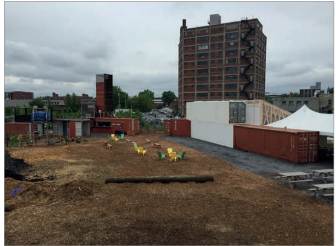
ILL. 24. L'ESPLANADE ET LE GRAND HALL DU VIRAGE. | JONATHAN CHA.

de la Faculté de l'aménagement de l'Université de Montréal (architecture, architecture de paysage, design d'intérieur, design industriel, urbanisme). Dans des concours prenant la forme de workshops, des professeurs, des chargés de cours et des professionnels ont supervisé, jugé et sélectionné les propositions les plus originales et réalistes. Les étudiants ont par la suite été encadrés (sous forme de stages) par MVM et des bureaux professionnels et ont participé au processus de coconstruction du lieu en usine et in situ , en collaboration avec de jeunes diplômés et des entrepreneurs 54 . Ce type d'approche très structurée misant sur la multidisciplinarité et la formation n'est pas sans heurts (difficulté à trouver des étudiants motivés et disponibles, beaucoup de temps d'encadrement et de logistique, manque d'expérience des intervenants, difficulté d'avoir des professionnels expérimentés en raison des faibles ressources financières, collaboration nécessaire entre les acteurs, temps limité), mais a l'intérêt de passer rapidement de l'idée à la réalisation, de favoriser l'expérimentation et de forcer « les designers à vivre et à observer intensément le site du projet 55 ».