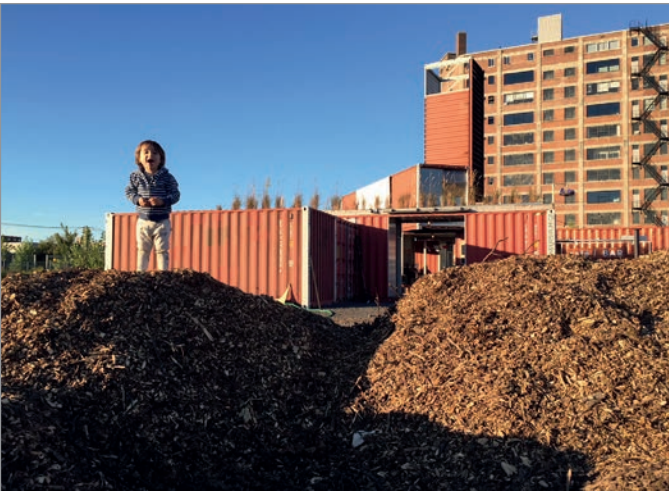
ILL. 19. AIRE DE JEU INFORMELLE AU VIRAGE POUR LE PLAISIR DES TOUT PETITS. | JONATHAN CHA.