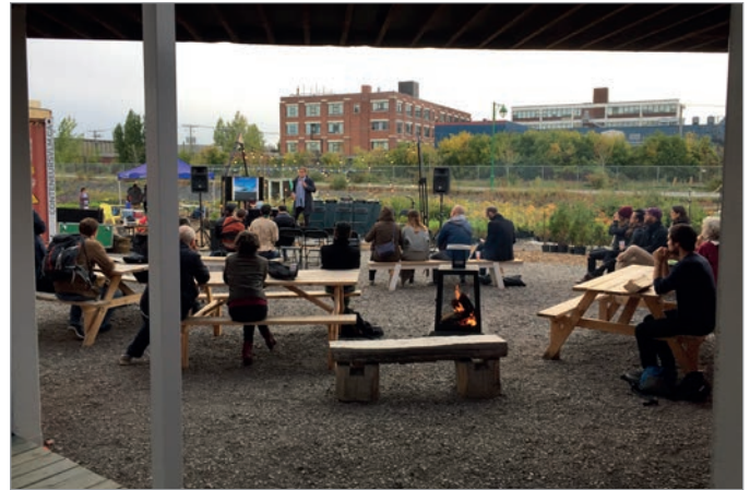
ILL. 18. UNE CONFÉRENCE EXTÉRIEURE DANS L'AGORA AU VIRAGE VUE DEPUIS LE PASSAGE COUVERT. | JONATHAN CHA.