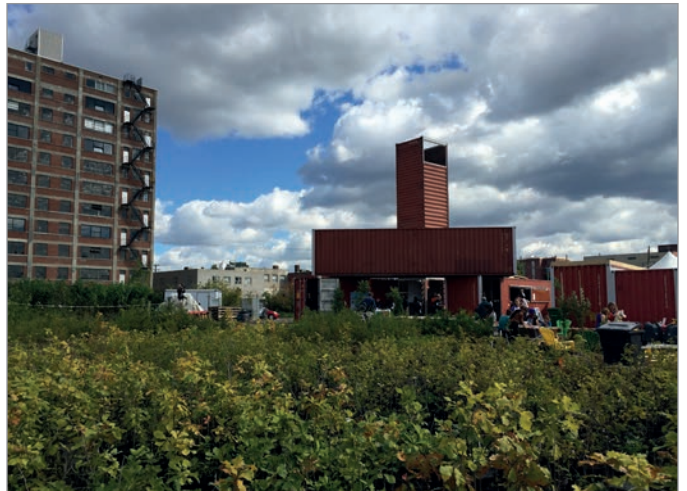
ILL. 20. LES JARDINS ÉPHÉMÈRES ENTOURANT LE VIRAGE. | JONATHAN CHA.

réalité et une attente grandissantes pour la population. Le prototypage du Virage et des projets éphémères dépasse les limites de la pratique urbanistique habituelle. Il offre à l'Université de Montréal et à la Ville de Montréal la possibilité « d'intervenir entre les réalités et les potentialités », la flexibilité dans la planification et l'élaboration des politiques, tout en gardant les choses ouvertes, tandis que des solutions provisoires sont anticipées, développées ou rejetées 49 .