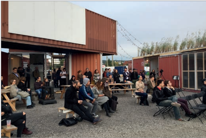
ILL. 17. UNE CONFÉRENCE EXTÉRIEURE DANS L'AGORA DU VIRAGE. | JONATHAN CHA.