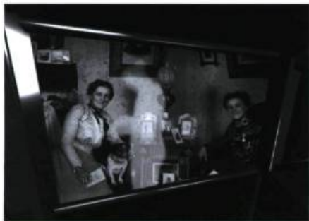
version 1 • Rues Amherst/Ontario, Montréal, Québec août 1996, en collaboration avec le GIV

Images et texte Gisèle Trudel à l'invitation de Philippe Côté