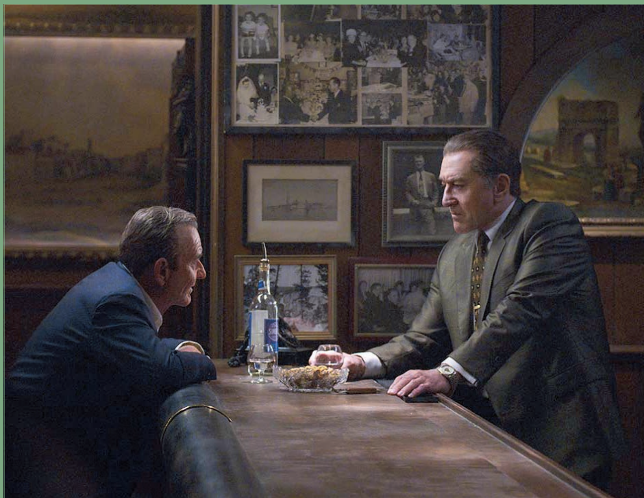
↑ The Irishman de Martin Scorsese (2019)