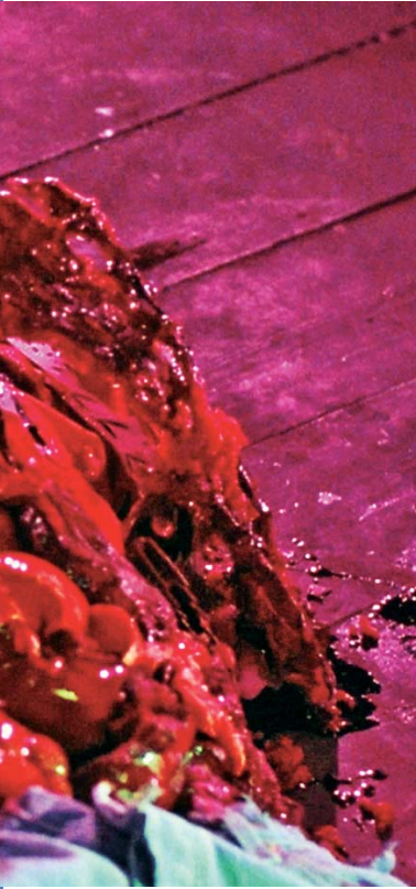
↑ From Beyond de Stuart Gordon (1986)

« Je ne puis essayer, messieurs, de vous traduire cette chose, cette voix, pas plus que je ne puis me risquer à en décrire le détail. »