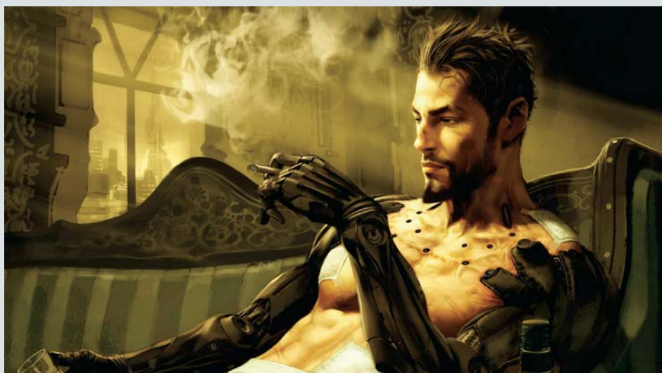
↑ Deus Ex: Human Revolution (2011) ← Zelda: Breath of the Wild (2017)