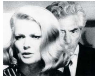
Massacre de Mỹ Lay, Vietnam | Couverture Nègres blancs d'Amérique de Pierre Vallières | Les chars soviétiques entrent dans Prague | La semaine politique (Cinéma Verdi, Montréal) | Le mandat de Ousmane Sembène | Faces de John Cassavetes