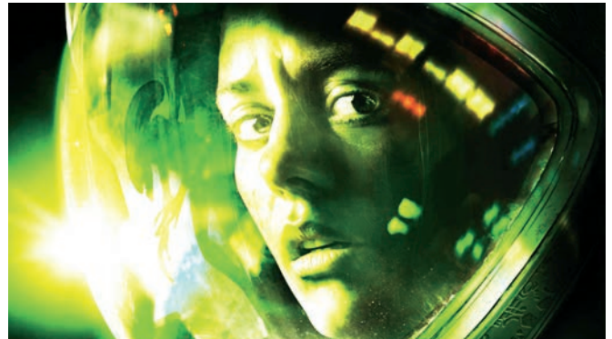
Alien: Isolation (2014)

recherche du joueur. Malgré la présence, bien illusoire, de quelques armes, celui-ci est totalement démuné face à la créature, qui ne peut pas être tuée, et doit utiliser au mieux son environnement immédiat pour fuir ou se cacher. Un bouton permet même de retenir sa respiration lorsque l’on est enfermé dans un placard, l’ alien étant extrêmement sensible aux mouvements et aux sons émis par le personnage.