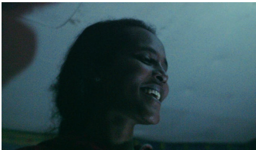
L'Héroïque Lande, la frontière brûle (2017)

de La Blessure succèdent ici les sans droits d'une nouvelle matrice opaque, celle des camps qui tendent à se substituer aujourd'hui à la cité . De films en installations, le travail de Nicolas Klotz et Élisabeth Perceval s'avère une fois de plus d'une cohérence exemplaire, s'efforçant de ramener sur les rivages de la vie et dans le mouvement de l'Histoire tous « les hors du monde » de la modernité. Dans L'Héroïque Lande, la frontière brûle , les cinéastes répondent à un appel lancé par notre époque - où les discours anti-immigration trouvent de plus en plus d'échos - pour produire des images non récupérables par l'ordre social avec une foi inébranlable dans ce présent aux riches potentialités qu'Agamben associe à « ce qui reste non vécu. »