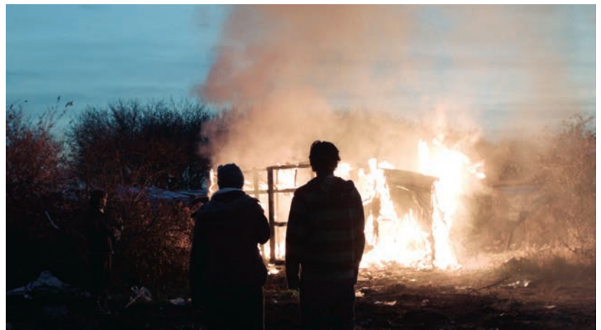
L'Héroïque Lande, la frontière brûle (2017)

Chapitré en 4 parties, L'Héroïque Lande, la frontière brûle est un chantier au long cours entrepris par deux créateurs (Klotz à la caméra, Perceval au son) qui ont décidé de radicaliser plus avant leur pratique commune afin d'assurer une présence du cinéma dans un de ces lieux d'exception où le réfugié, Homo Sacer des temps modernes, est confronté à tous les arbitraires. Échelonnée sur plusieurs mois de tournage, l'aventure tient de l'essai cinématographique, un essai fureteur en quête d'une forme susceptible de redonner au regard sa pleine mesure. L'intitulé du premier chapitre, Naissance d'une nation , n'est pas anodin. De fait, il renvoie tant au film mythique (1915) de D. W. Griffith qui a défini la grammaire du cinéma, notamment par le montage, qu'à l'édification de la nation américaine née dans la violence raciale. À sa façon, avec de l'équipement léger et sans cadre de production, L'Héroïque Lande, la frontière brûle revient humblement aux origines du septième art en réinventant un mode de travail adapté au temps présent. Dans la Jungle, cet espace d'exception où s'entassent les sacrifiés de notre monde, de nouvelles formes de vie cristallisent, portées par l'énergie d'une communauté naissante, invisible aux yeux des pouvoirs politique et médiatique. Aux sans-abri de Paria et aux sans papiers