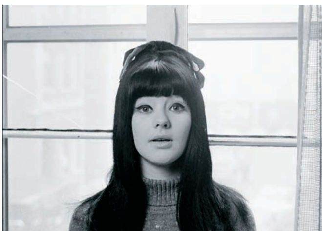
All You Can Eat Bouddha de Ian Lagarde et La part du diable de Luc Bourdon