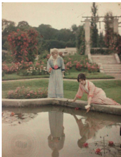
Figure 10. Charles Adrien, La cueillette du nénuphar , sans date, autochrome, 9 x 12 cm.