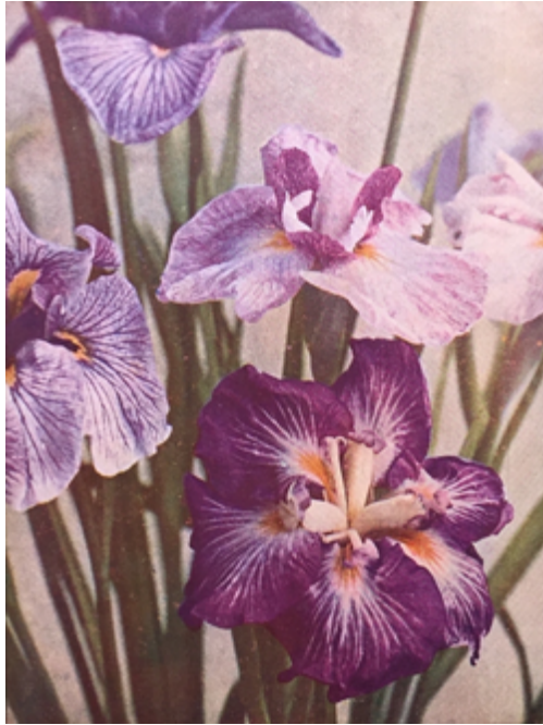
Figure 5. Les Iris de Kempfer . Culture des Pépinières Moser, à Versailles, autochrome reproduite en couverture de Jardinage , 1911, no 1.

¶ 22 Passé la couverture en couleurs, les pages intérieures étaient quant à elles profusément illustrées de photographies en noir et blanc. Cette composition des livraisons, inaugurée par Jardinage en 1911, se maintint jusqu'en 1932, année où elle devait paraître complètement obsolète. La stabilité formelle de la revue durant vingt ans s'accompagna d'ailleurs de nombreux remplois des mêmes images, à quelques années d'intervalle.