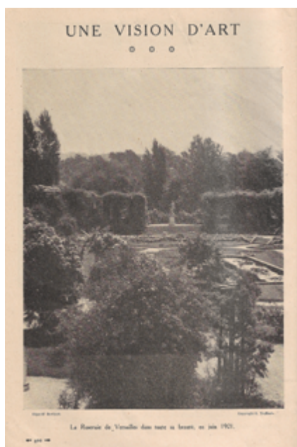
Figure 7. Une vision d'art. La Roseraie de Versailles dans toute sa beauté, en juin 1921 , photographie reproduite dans Jardinage , 1922, no 64, p. 400.