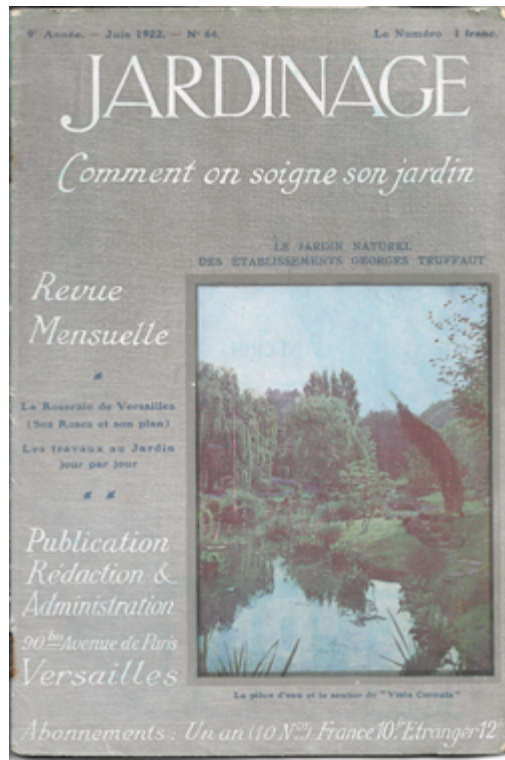
Figure 9. Le Jardin naturel des établissements Georges Truffaut , autochrome reproduite en couverture de Jardinage , 1922, no 64.

932 La roseraie des Établissements Georges Truffaut à Versailles était manifestement inspirée de celle de Jules Gravereaux à L'Haÿ. Ordonnée symétriquement en amphithéâtre autour d'un bassin de nénuphars, elle était ceinte à son extrémité par une pergola (voir la figure 10). Les articulations du plan étaient marquées par des sculptures copiées sur des œuvres célèbres du musée du Louvre, datées du 18 e siècle français, une Compagne de Diane de René Frémin (1710-1714) et L'Amour menaçant d'Étienne-Maurice Falconet (1757), ou de l'époque hellénistique, pour l'Enfant luttant avec une oie 37 (voir la figure 11).