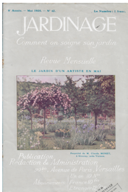
Figure 6. Le Jardin d'un artiste en mai . Propriété de M. Claude Monet à Giverny, près Vernon, autochrome reproduite en couverture de Jardinage , 1920, no 42.

928 Tout en consacrant l'attractivité visuelle du magazine, les couvertures en couleurs de Jardinage proposaient à l'œil du lecteur un aliment pour satisfaire ses appétits d'horticulteur ou même de photographe amateur, un support à partir duquel son imagination se projetait vers le désir de réaliser son propre jardin, d'après des modèles prestigieux.