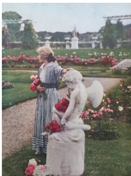
Figure 11. Charles Adrien, Roseaie des établissements Georges Truffaut , autochrome reproduite en couverture de Jardinage , 1920, no 40.