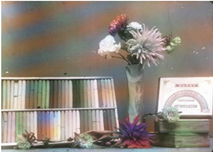
Figure 3. Publicité pour un nouveau procédé photographique couleur , sans date, dioptichrome Dufay, 9 x 12 cm.

911 Après avoir triomphé de ses concurrents, l'autochrome Lumière trouva à son tour dans la fleur un moyen de démontrer l'étendue de son chromatisme, et de permettre à ses usagers, assurés de l'attractivité du résultat, de mettre en valeur leur goût et leur art.