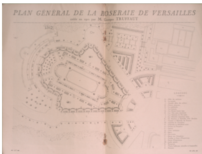
Figure 8. Plan général de la roseraie de Versailles créée en 1911 par M. Georges Truffaut , illustration reproduite dans Jardinage , 1922, no 64, p. 408–409.