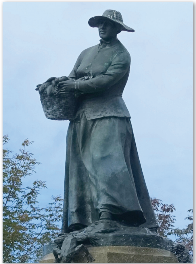
Monument intitulé La Fermière dans Hochelaga-Maisonneuve