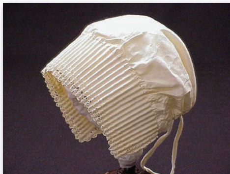
Coiffe ou « gréliche » de postulante, début du xx e siècle.

De plus, la vocation de la Congrégation oblige à porter une attention au développement de la médecine. Ce sont les avancées de celle-ci dans la seconde moitié du xx e siècle, jointes à la permission qu'ont les Religieuses Hospitalières de Saint-Joseph qui travaillent dans les différents services de l'Hôtel-Dieu de Montréal, soit dans les infirmeries, les pharmacies, les cuisines, les buanderies et les autres nécessités, de porter un uniforme entièrement blanc, que les autorités du Vatican octroient, qui permettent l'adoption de ce dernier. Les indications inscrites au Coutumier de 1953, c'est-à-dire dans le manuel qui précise les détails de l'habit comme les normes de la vie quotidienne des sœurs, soulignent ce changement. Celles qui œuvraient à l'hôpital revêtaient auparavant des manches blanches par-dessus celles de leur robe noire et un tablier blanc 15 .