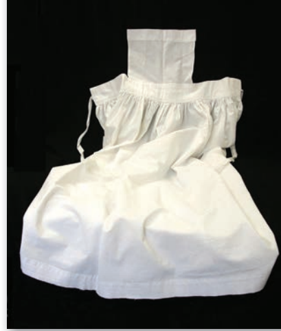
Manches et tablier de costume utilisés par les Religieuses Hospitalières de Saint-Joseph de Montréal lorsqu'elles étaient en service à l'Hôpital Hôtel-Dieu de Montréal, vers 1950.

Détails pour certains, mais qui marquent la différence pour d'autres, ceux-ci soulignent l'importance pour un muséologue d'avoir une curiosité et une connaissance encyclopédique qu'il affine ensuite en fonction du sujet qu'il aborde, ici, l'évolution du costume religieux d'une congrégation à travers les artefacts conservés. Ce sont elles qui lui permettent de tisser des liens entre les éléments et leur réalité passée et présente, afin de les comprendre, puis de les transmettre. L'étude et la conservation du vêtement, qu'il soit soumis à une évolution lente – costume – ou rapide – vêtement dit de mode – s'avèrent donc plus complexes que les qualificatifs futile et trivial, mentionnés précédemment, ne le laissent supposer.