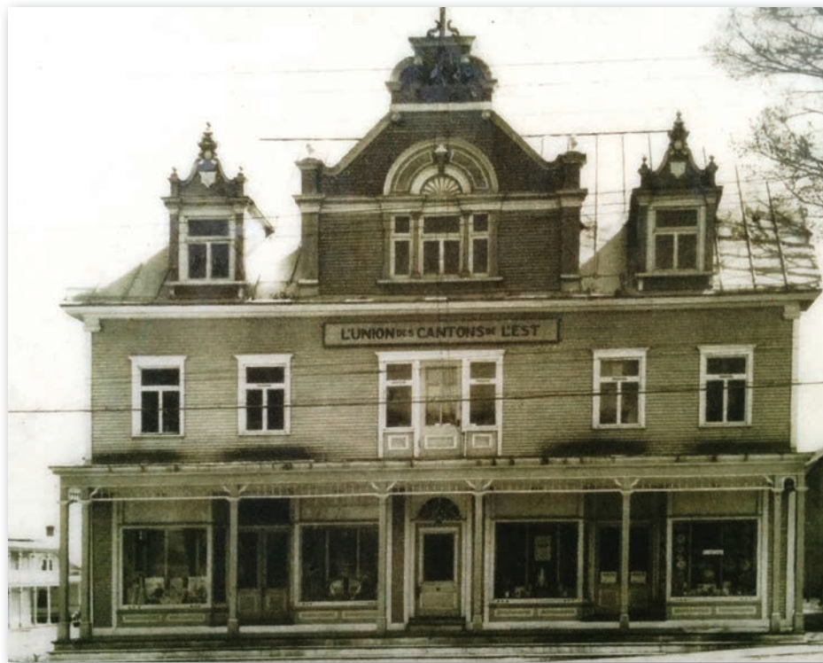
L'édifice de L'Union des Cantons de l'Est en 1926.