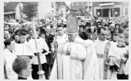
Visite de l'évêque de Sherbrooke (M sr Cabana) à Lac-Mégantic en 1955. Après les années 1920, l'Église catholique occupe sans restriction l'espace public.

Si, sur le plan ouvrier, le clergé s'oppose aux syndicats américains et favorise les syndicats catholiques, ce même clergé régional rêve d'une société différente, aux valeurs ultramontaines, voire corporatistes (inspirées tant de l'Ancien Régime que des régimes autoritaires comme ceux de Salazar, Mussolini, Franco ou Pétain), une société qui ne connaîtrait aucune séparation entre la vie civile et les organisations catholiques 27 . Ces théories postulent que, dorénavant, la société franco-catholique n'a plus à tenir compte d'un partage de la vie civile avec les Anglo-protestants.