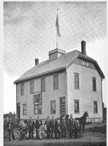
Dans certains villages anglophones des Cantons-de-l'Est, le sentiment anti-catholique et anti-français se développe à la fin du XIX e siècle, favorisant l'organisation de loges orangistes. Officiers de la loge Lord Erne Loyal Orange et leur lieu de réunion à Waterville en 1896. (Source : L.S. CHANNELL, History of Compton County, Sherbrooke , 1896, p. 200)

La tension culturelle la plus ancienne dans la région fut le clivage entre d'une part, les Loyalistes et les Britanniques immigrés et, d'autre part, les Américains d'esprit républicain,