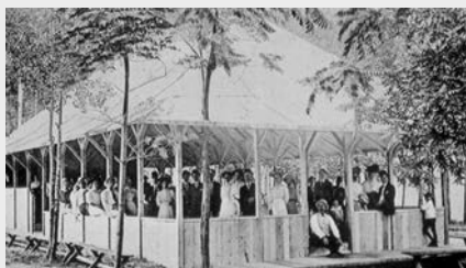
Pavillon de danse à Coney island, près de Windsor (vers 1905) Les lieux de loisirs et de plaisirs se multiplient au début du XX e siècle, malgré les mises en garde répétées du clergé catholique.

Les Américains sont les fils des Révolutionnaires de 1776. Ils sont le premier peuple colonisé à avoir arraché par les armes leur indépendance. Ils privilégient la démocratie locale, de proximité, par laquelle les individus libres et propriétaires consentent à se taxer pour se doter de routes ou d'écoles. Ils ont un sens de la liberté individuelle, de l'initiative et se méfient de l'étatisme.