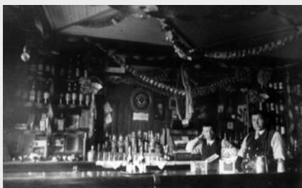
Le bar de l'hôtel du Canadien Pacifique à Lac-Mégantic vers 1900 est bien fourni! Le clivage entre Canadiens français et Anglo-protestants au Conseil municipal des villages de Mégantic et d'Agnès fera se succéder en peu d'années périodes de prohibition totale et systèmes de licences.

Leur sentiment religieux est plus à l'aise dans les églises évangéliques, les sectes ou les dissidences.