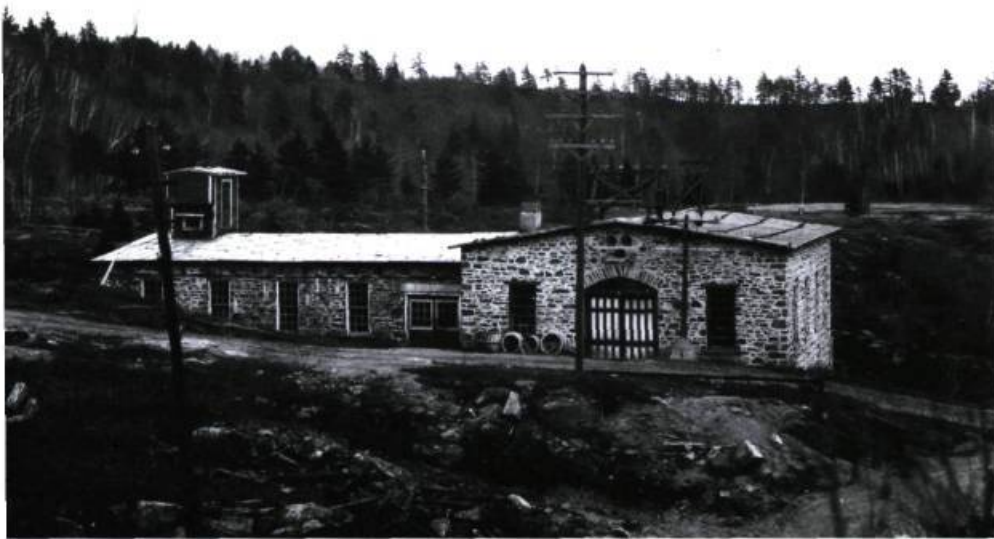
La première centrale hydroélectrique de la Mauricie a vu le jour à Saint-Narcisse, en 1897.

De fait, suite aux constructions de barrages et aux multiples aménagements, au cours du XX e siècle, la rivière Saint-Maurice est devenue incontestablement l'un des cours d'eau le mieux régularisé en Amérique du nord. Il existe peu de régions sur le continent où on a mis en service douze centrales sur une même rivière. Les centrales du Saint-Maurice se sont distinguées à l'époque de leur mise en service par la puissance de leurs installations et l'on peut sans doute qualifier la Mauricie de Baie James du temps. Encore aujourd'hui, en dépit de leur ancienneté, les huit centrales du Saint-Maurice produisent près de 10% de la production totale du Québec.