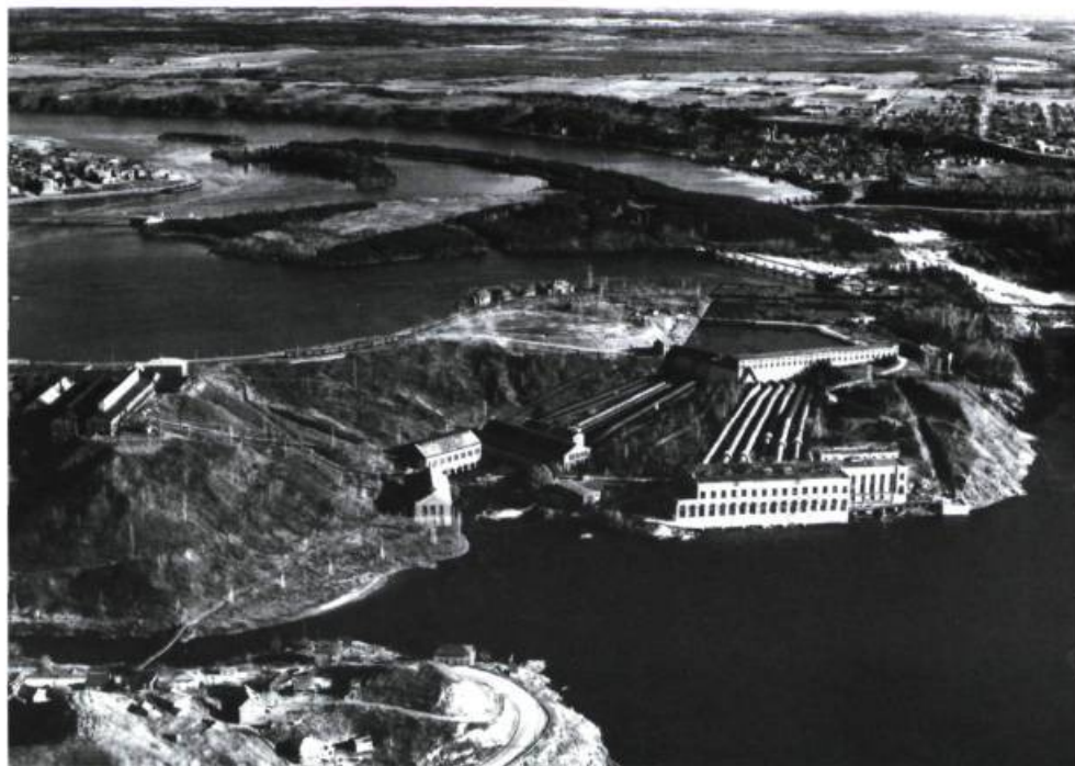
Le complexe hydroélectrique de Shawinigan tel qu'il existait en 1945 avec notamment les centrales Shawinigan 1 et 2 de la Shawinigan Water and Power ainsi que les deux centrales de l'Alcan.

En somme, on se doit de constater que la naissance et, par la suite, le développement de l'industrie hydroélectrique en Mauricie, ont joué conjointement le rôle d'un puissant facteur d'industrialisation. Pendant plusieurs décennies, le Saint-Maurice fut considéré comme le principal foyer de l'hydroélectricité au Québec. Certes, sur le plan des sources de production électrique, la mise en place de la centrale nucléaire de Gentilly 2, en 1983, a rompu avec cette « tradition ». Il n'en demeure pas moins qu'encore de nos jours, l'exploitation de l'électricité dans la région repose prioritairement sur la force hydraulique. En ce sens, hier comme aujourd'hui, la rivière Saint-Maurice et l'hydroélectricité qu'elle génère font toujours honneur à la Mauricie. ■