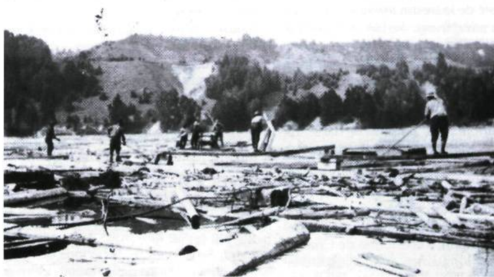
La forêt : la drave sur la rivière Malbaie.

Mais, malgré tout le pittoresque de cette tradition navale, la région de Charlevoix demeura très isolée jusque vers 1850 particulièrement. À partir de ce moment, des estivants se rendirent en grand nombre dans la région à bord d'imposants bateaux de croisière à vapeur. Ces bateaux furent opérés par la Richelieu Co. et plus tard par la Canada Steamship's Line. Leur existence assura à la région une réputation enviable comme site de villégiature et de tourisme. Ces bateaux blancs, comme les surnommèrent les gens de la région, ont navigué durant plus de 100 ans sur les bords de Charlevoix à chaque été. C'était au temps de la belle époque des croisières qui se rendaient vers le Saguenay et où des touristes huppés pouvaient s'arrêter pour séjourner dans des hôtels de grande classe comme le Manoir Richelieu et l'Hôtel Tadoussac et goûter ainsi à loisir les splendeurs du paysage charlevoisien. Malheureusement, ces bateaux de croisière dis-