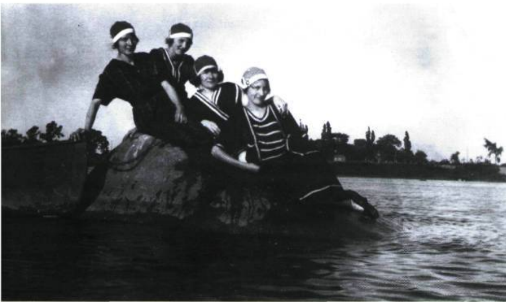
Les baigneuses. Photographie prise à Boucherville dans les années 1920.

Évidemment, c'est bien beau de pouvoir se rendre dans la belle campagne de Boucherville; cependant, il faut avoir le temps et l'argent pour se le permettre. Mais qui peut bien en avoir les moyens? En cette fin de siècle, en pleine période d'industrialisation, les hommes travaillent en général