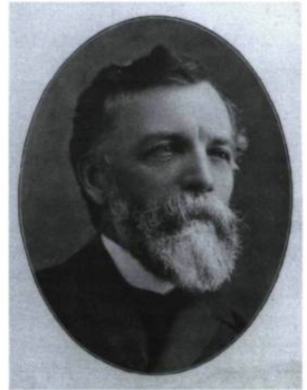
Joseph-Israël Tarte.

Né en 1848 à Lanoraie, Joseph-Israël Tarte devient notaire en 1871. Journaliste au Canadien de Québec en 1874 dont il devient le propriétaire, il publie aussi une édition hebdomadaire à partir de 1875 : le Cultivateur . Joseph-Israël ne peut cependant tenir le coup financièrement et doit vendre ses parts dans ces deux derniers journaux. Il en demeure toutefois le rédacteur en chef. Il occupe aussi ce rôle pour un autre journal, l'Événement , à partir de 1883. Enfin, en 1897, il acquiert d'Honoré Beaugrand le journal La Patrie . Du côté politique, Joseph-Israël sera député conservateur de 1877 à 1881 à l'Assemblée législative et député fédéral de 1893 à 1902. Il sera ministre des Travaux publics de 1896 à 1902 dans le cabinet de Wilfrid Laurier.