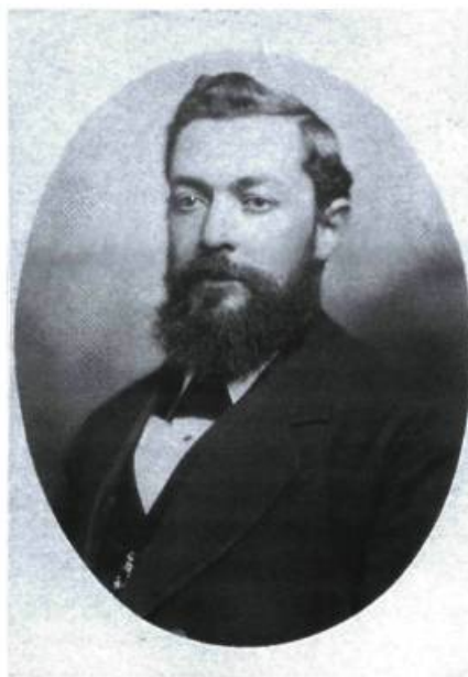
Charles Desmarteau.

Charles Desmarteau peut être considéré comme le pionnier des villégiateurs à Boucherville. Né à Boucherville en 1839, Charles Desmarteau acquiert très tôt un établissement commercial à Montréal et devient rapidement prospère. Ses services à titre de comptable sont utilisés par des compagnies et des particuliers. Il se taille une forte réputation professionnelle et développe des contacts avec les dirigeants de la société montréalaise de l'époque. Il est élu conseiller pour le district Sainte-Marie en 1869 et est