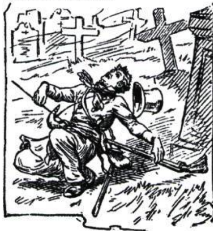
Le Dr. Jean-Olivier Chénier est tué alors qu'il tente de s'échapper de l'église de St-Eustache en flamme