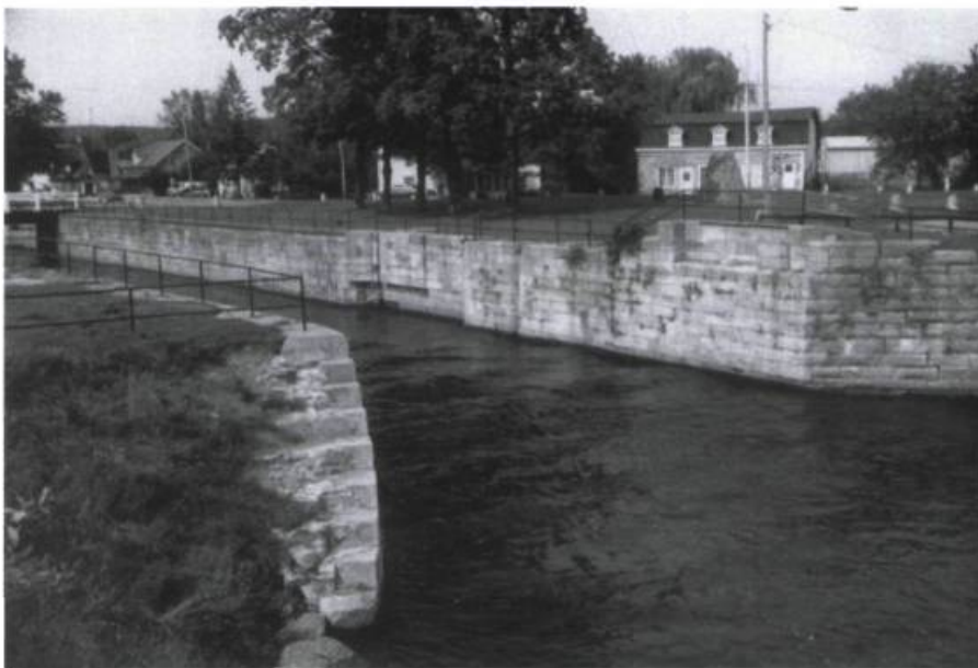
Canal de Carillon à Granville.

Où sont allés tous les raftmanns? Dedans Bytown sont arrêtés Bing sur le ring Laissez passer les raftmanns Bing sur le ring, bing bang! Dedans Bytown sont arrêtés Dans les chantiers ils sont montés Des provisions ont apporté Sur l'Outaouais s'sont dirigés En canot d'écorce ont embarqué Dans les chantiers sont arrivés Des manch's de hach's ont fabriqué Ils ont joué de la cognée À grands coups de hach's trempé's Pour l'estomac leur restaurer Des porc and beans ils ont mangé Après avoir très bien dîné Un' pip' de platr' ils ont humé Quand le chantier fut terminé S'sont mis à fair' du bois carré Pour leur radeau bien emmancher En plein courant se sont lancés Sur l'ch'min d'Ayulmer ils ont passé Avec l'argent qu'ils ont gagné Sont allés voir la mèr' Gauthier Et les gross's fill's ils ont d'mamdé Ont pris du rhum à leur coucher Et leur gousset ont déchargé Le médecin ont consulté