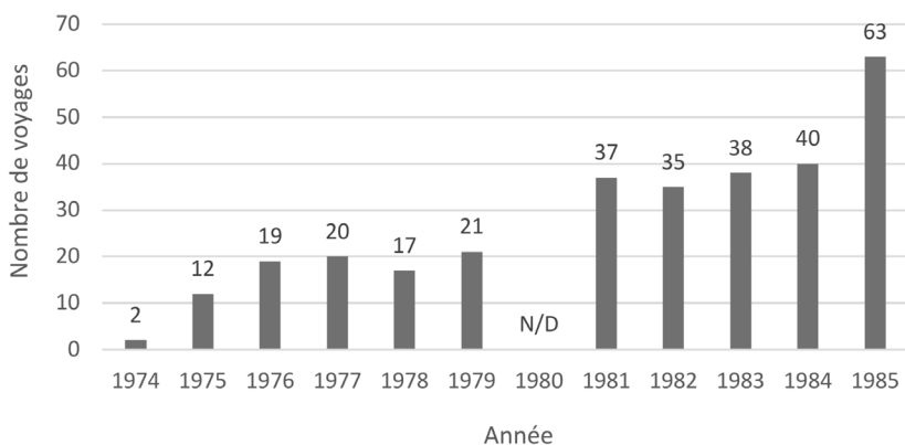
Figure I Le nombre de voyages réalisés par la Cour itinérante, 1974-1985

Source : BAnQ, Fonds P277, série 3, sous-série 7, dossier I.