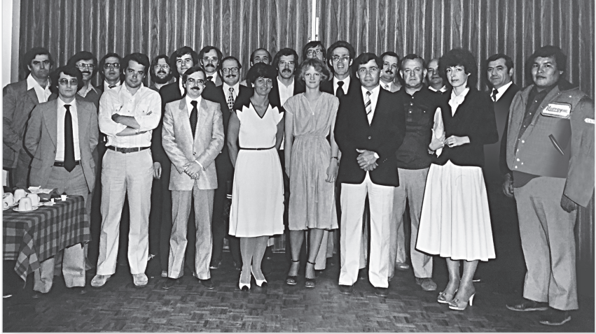
Figure 2 Une photographie de la Cour itinérante lors de sa première réunion de coordination avec les autres services publics (Rouyn-Noranda, le 29 mai 1980)