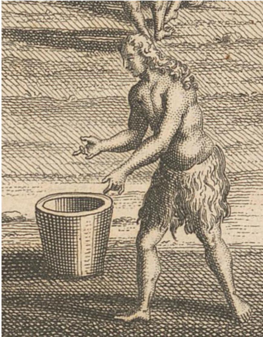
Conseil des Floridiens , dans Lafitau, Joseph François (1724). Moeurs des sauvages américains , Paris, C.-M. Saugrain et Ch.-E. Hochereau.