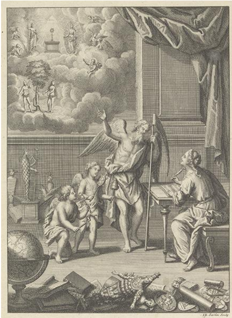
Frontispice, Jean-Baptiste Scotin (« sculp. »), dans Lafitau, Joseph François (1724). Moeurs des sauvages américains , t. 1.

Bibliothèque de Genève, cote BGE fa 917 1