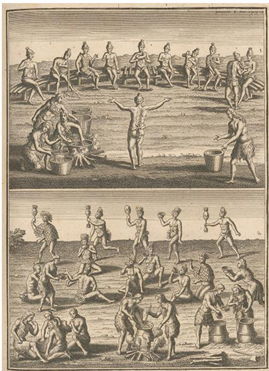
Conseil des Floridiens , dans Lafitau, Joseph François (1724). Mœurs des sauvages américains , Paris, C.-M. Saugrain et Ch.-E. Hochereau.