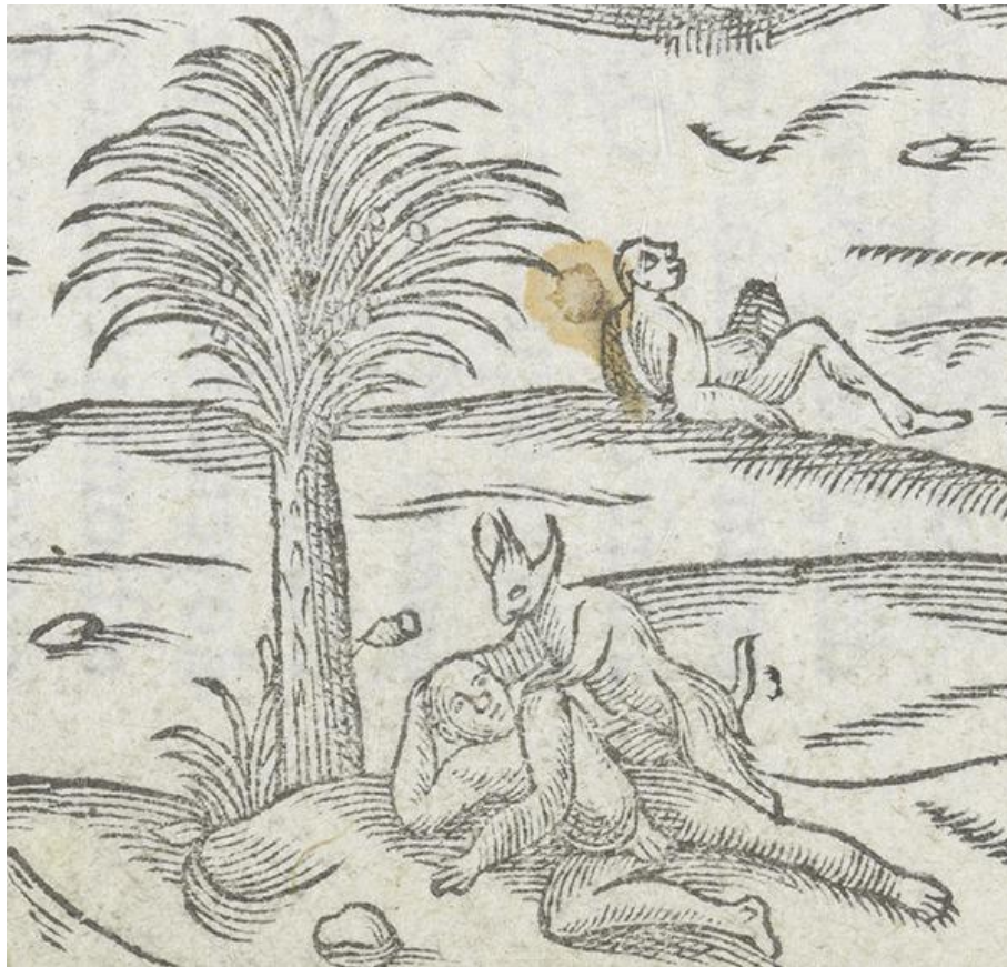
Léry, Jean de (1580). Histoire d'un voyage fait en la terre du Bresil , Genève, p. 235.

Bibliothèque de Genève, cote BGE fb 794w