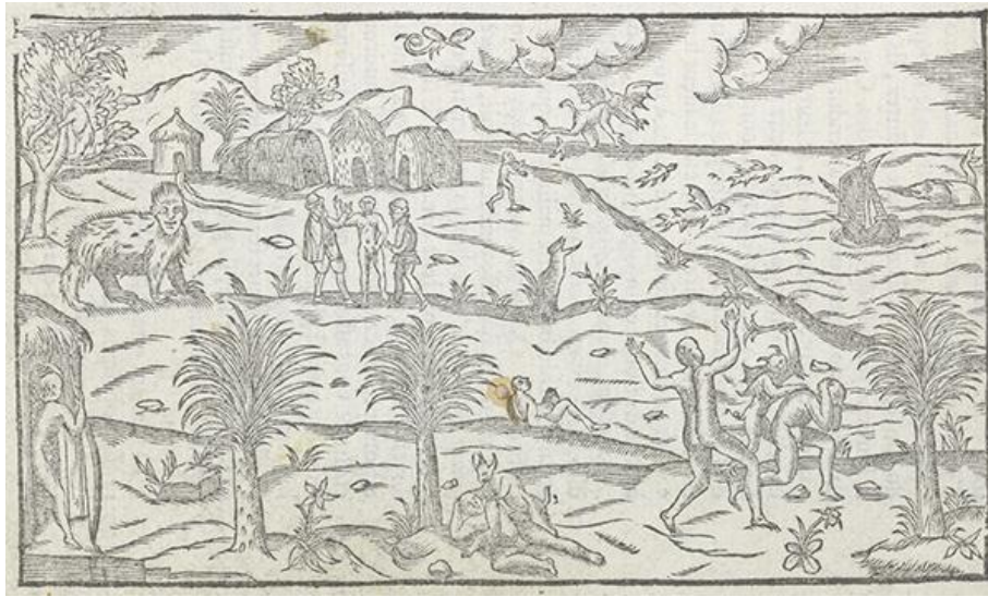
Léry, Jean de (1580). Histoire d'un voyage fait en la terre du Bresil , Genève, p. 235.

Bibliothèque de Genève, cote BGE fb 794w