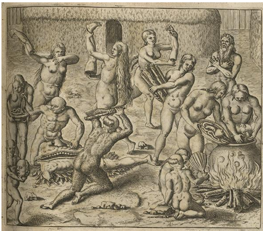
Banquet cannibale , Théodore de Bry [iii. Staden-Léry], titre complet : (1592). America tertia pars , Francofurti, p. 159.