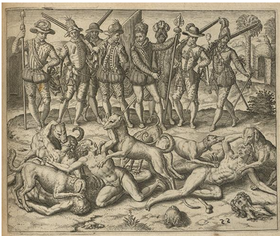
Valboa Indos nesandum sodomiae... (planche xxii), Théodore de Bry, Grands voyages , [iv. Benzoni], titre complet : Benzoni, Hieronymus (1594). Americae pars quarta , Francofurti, p. 193.

Fondation Martin Bodmer – Numérisation Bodmer Lab., Université de Genève