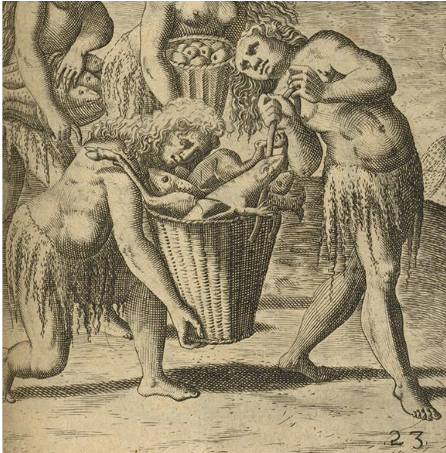
Ferinae, piscium & reliquae... (planche xxiii), Théodore de Bry, Grands voyages [ii. Le Moyne de Morgues], titre complet : Le Moyne, iacobo (1591). Brevis narratio eorum quae in Florida Americae... , Francoforti Ad Moenum, Typis Ioanis Wecheli, p. 79.