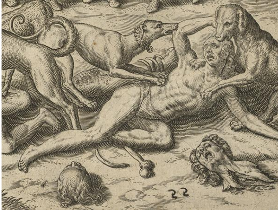
Figures 1a et 1b (détails)