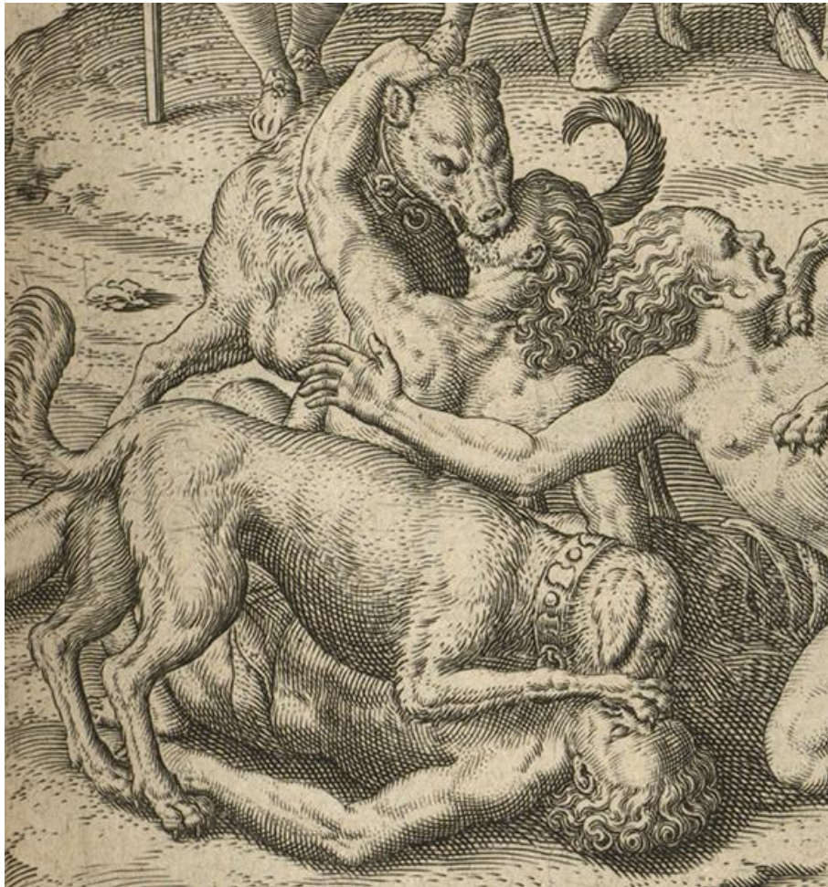
Valboa Indos nesandum sodomiae... (planche xxii), Théodore de Bry, Grands voyages , [iv. Benzoni], titre complet : Benzoni, Hieronymus (1594). Americae pars quarta , Francofurti, p. 193.

Fondation Martin Bodmer – Numérisation Bodmer Lab., Université de Genève