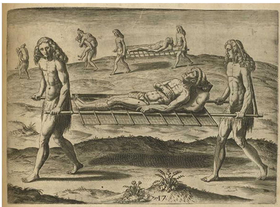
Hermaphroditorum officia (planche xvii), Théodore de Bry, Grands voyages [ii. Le Moyne de Morgues], titre complet : Le Moyne, iacobo (1591). Brevis narratio eorum quae in Florida Americae... , Francoforti Ad Moenum, Typis Ioanis Wecheli, p. 67.