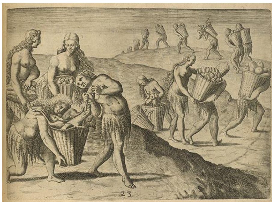
Ferinae, piscium & reliquae... (planche xxiii), Théodore de Bry, Grands voyages [ii. Le Moyne de Morgues], titre complet : Le Moyne, iacobo (1591). Brevis narratio eorum quae in Florida Americae... , Francoforti Ad Moenum, Typis Ioanis Wecheli, p. 79.

Fondation Martin Bodmer – Numérisation Bodmer Lab., Université de Genève