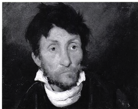
Théodore Géricault, Le Monomane , 1822

De là la peur, l'effroi, que réfléchit, comme dans un miroir déformant, grossissant, la folie. Personne n'en est dupe. Les Monomanes de Géricault en sont une troublante illustration. On raconte qu'une large bannière affichant ce Monomane et surplombant une voie publique fort achalandée, lors d'une grande exposition à Paris, il y a quelques années, a dû être enlevée.