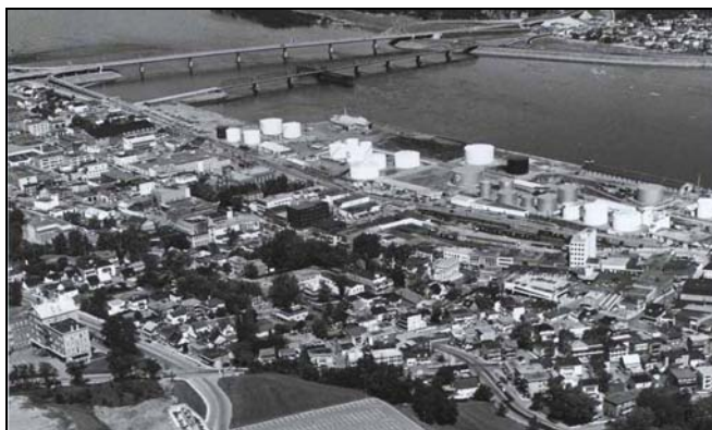
Fig. 2 – Utilisation du sol au centre