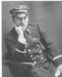
Fig. 3 – « Le père, mort très tôt »

Source : Roland Barthes par Roland Barthes , Paris, Seuil, 1975, p. 29.