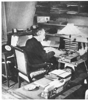
Fig. 6 – À la table de travail

On comprend dès lors pourquoi Barthes a inséré trois photographies de lui-même écrivant: c'est l'image désirée (figure 6), celle à laquelle le «sujet» veut ressembler.