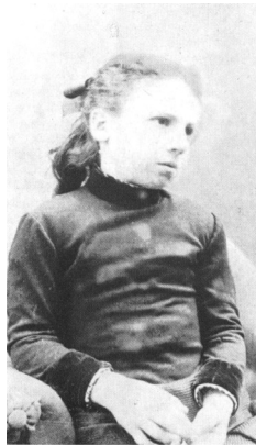
Fig. 1 – « La sœur du père : elle fut seule toute sa vie. »

Dans cette entreprise de collection de soi, la photographie n'a pas vocation d' imago , d'image « une » de l'identité, mais participe de l'inventaire de l'imagier. Collectible , elle présente des éléments à collectionner — les parties du corps, en premier. L'image photographique ne se donne pas pour une vision « morphologique », mais pour le « rêve obtus dont les unités sont des dents, des cheveux, un nez, une maigreur, des jambes à longs bras, qui ne m'appartiennent pas, sans pourtant appartenir à personne d'autre qu'à moi 5 ». En fait, ces « unités » se retrouvent, ailleurs, dispersées, dans les photographies de famille. Des éléments qu'il dira appartenir à son corps « irréductible » sont vus sur d'autres et l'enfant Roland voit sa solitude chez la sœur de son père (fig. 1).