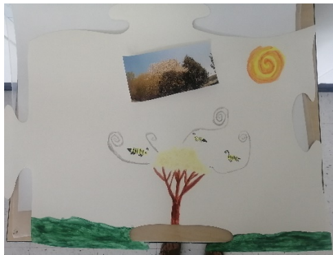
Figure 2. Exemples d'œuvres réalisées par les élèves

résultats préliminaires suggèrent ainsi que les élèves du primaire semblent ressentir le besoin de discuter des changements climatiques et de l'écoanxiété qu'ils ressentent et que, conséquemment, notre intervention a été utile à cet effet. De plus, la création artistique semble avoir favorisé l'expression émotionnelle des enfants, alors que les ateliers de PPE ont plutôt favorisé le processus réflexif et la flexibilité de pensée. Ce dernier aspect pourrait être favorisé par le fait que les dialogues philosophiques amèneraient les enfants à être plus ouverts et à s'engager dans des discussions complexes, reconfigurant certaines ressources mentales et perspectives (Kashdan et Rottenberg, 2010). Néanmoins, une évaluation empirique de cette approche est nécessaire pour bien en comprendre les effets sur les élèves.