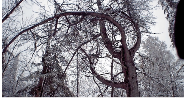
Photographie sur le thème de la beauté de la nature