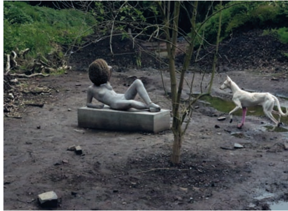
Pierre Huyghe, Untitled, 2011-2012, installation, dOCUMENTA (13), Kassel, 2012.