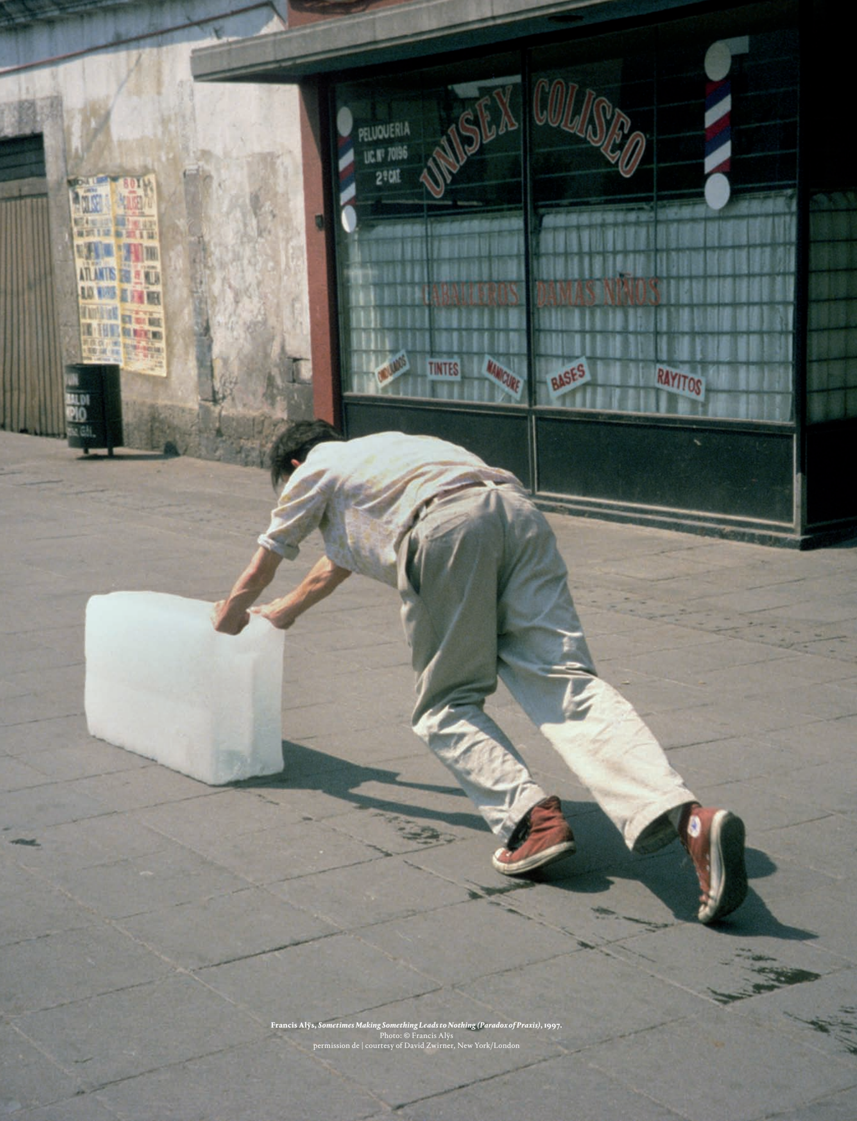
Francis Alÿs, Sometimes Making Something Leads to Nothing (Paradox of Praxis) , 1997.