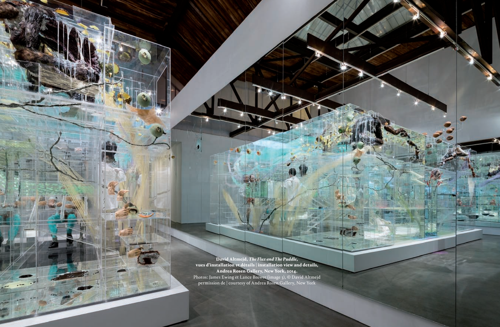
David Altmejd, The Flux and The Puddle , vues d'installation et détails | installation view and details, Andrea Rosen Gallery, New York, 2014. Photos: James Ewing et Lance Brewer (image 3), © David Altmejd permission de | courtesy of Andrea Rosen Gallery, New York