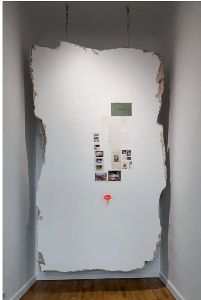
Walid Raad, Scratching on Things I Could Disavow: A History of Art in the Arab World , vue d'exposition | exhibition view, TBA21 Contemporary, Vienne, 2011.

Photo: Jakob Polascek, © Walid Raad, permission de | courtesy of Paula Cooper Gallery, New York