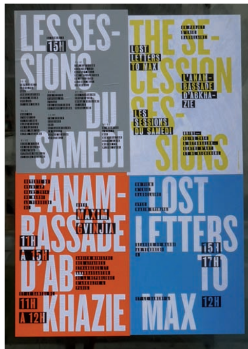
Eric Baudelaire, The Secession Sessions , Bétonsalon – Centre d'art et de recherche, Paris, 2014.