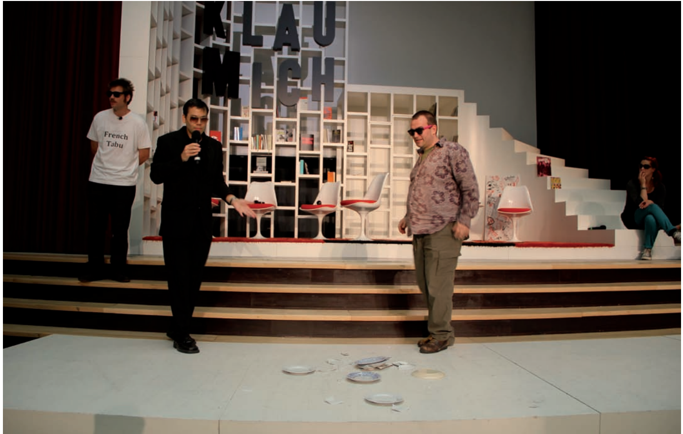
Dora García, Die Klau Mich Show: Radicalism in Society Meets Experiment on TV , dOCUMENTA13, Kassel, 2012.

Photo: Lauren Huret, © Dora García, Theater Chaosium & dOCUMENTA13, Kassel permission de l'artiste | courtesy of the artist