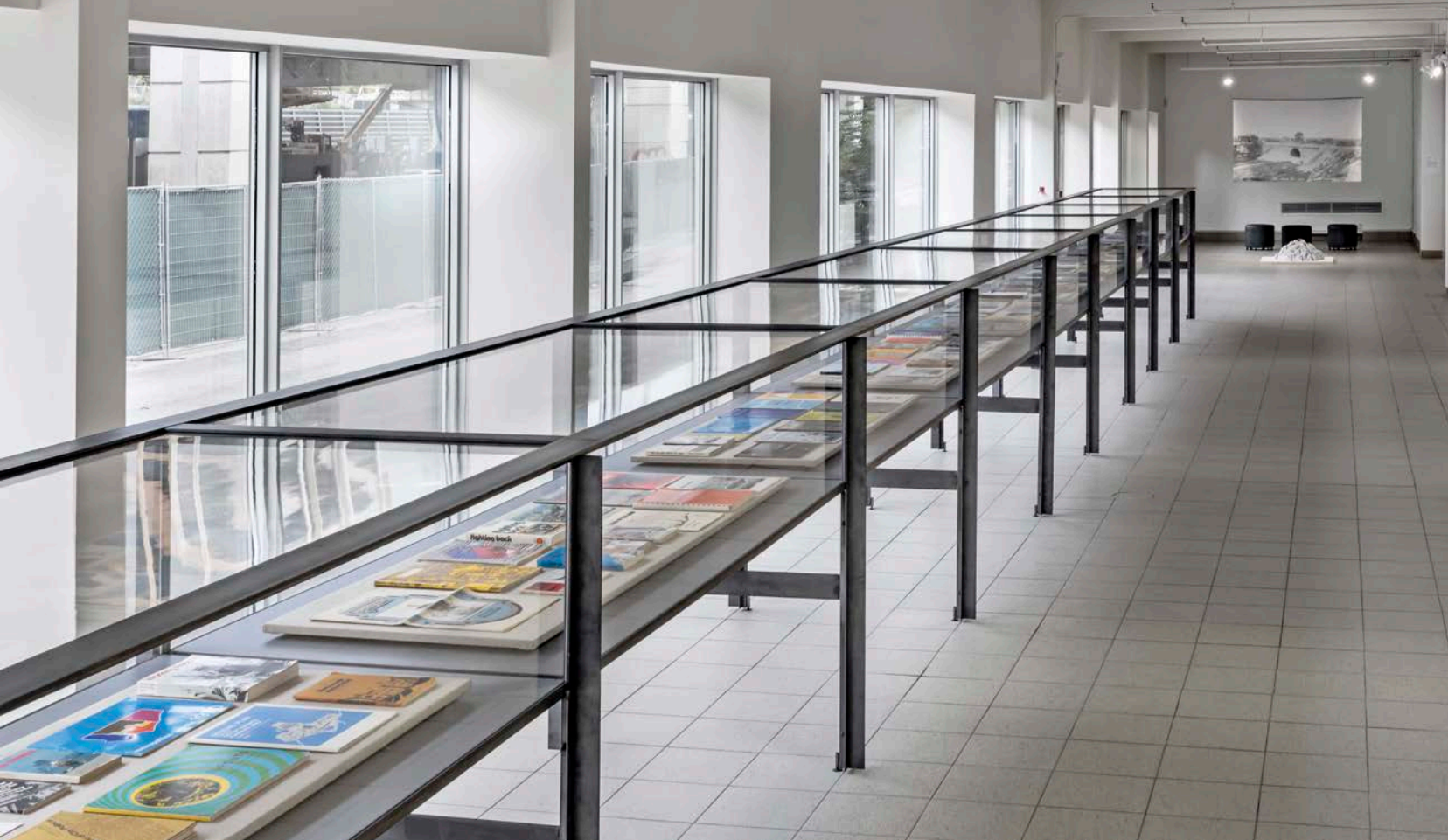
Luis Jacob , The View from Here (Library) , 2019. Collection de cartes et contenu imprimé publié de 1872 à 2019. Avec l'aimable permission de Toronto Biennial of Art. Photo : Toni Hafkenscheid.