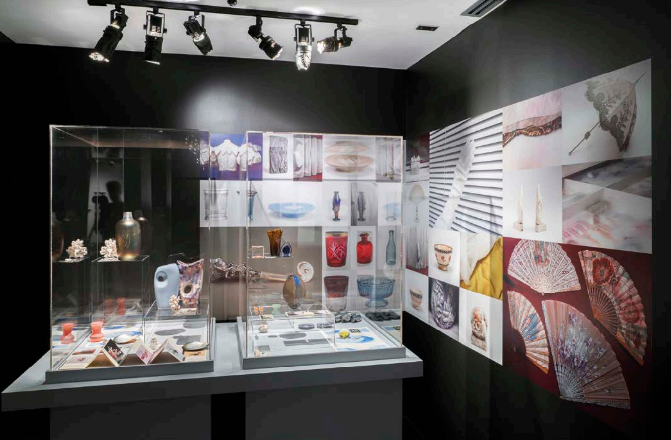
Celia Perrin Sidorous, L'archiviste , 2019. Vue de l'installation.

objets, notamment au moyen de la photographie, à travers l'histoire et l'évolution des ces dispositifs. Leur portée réelle s'affiche en transformation constante selon les époques, les contextes et le regard tourné vers eux.