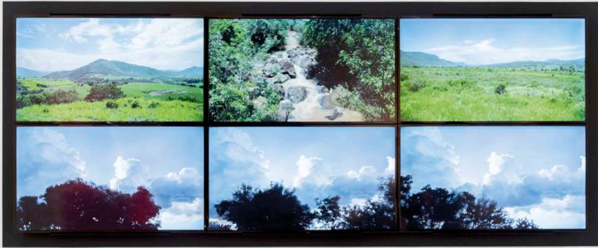
Rafael Ortega , Vidas, oficios y tareas , 2015. Installation vidéo. © MOMENTA | Biennale de l'image et Galerie de l'UQAM. Photo : Jean-Michael Seminario.

L'ouverture de MOMENTA | Biennale de l'image inaugurerait la rentrée culturelle de l'automne 2019 à Montréal. D'abord connu comme le Mois de la Photo, l'évènement célèbre aujourd'hui ses trente ans d'existence et sa deuxième édition sous une nouvelle dénomination. Avec une équipe renouvelée aux rôles et aux responsabilités conséquentes, cette dernière présentation témoigne de la direction prise par l'organisation pour les années à venir.