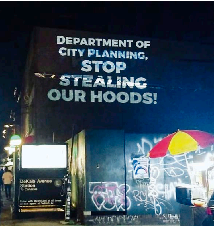
Mi Casa No Es Su Casa : Illumination Against Gentrification, The Illuminators et G-Rebels, #NoRezoningBushwick, 2018. Projection temporaire contestant un projet de modification de zonage qui permettra la construction de luxueux immeubles résidentiels dans un secteur de Bushwick, New York.