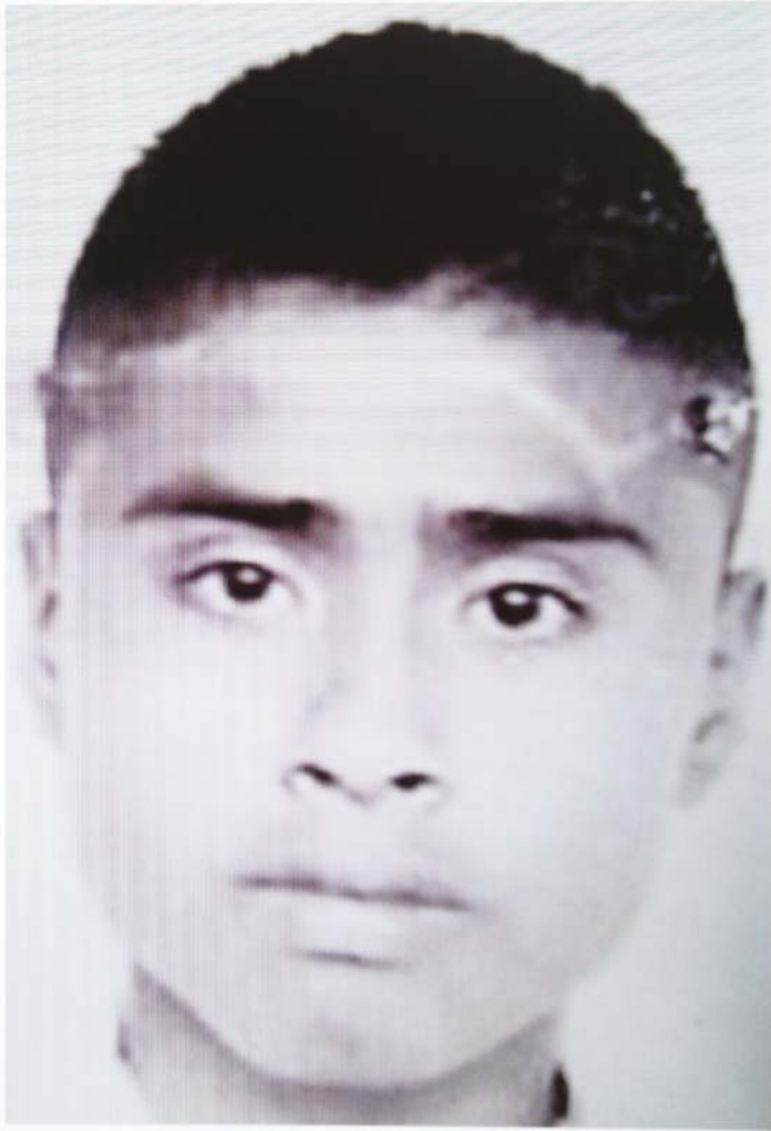
Rafael Lozano-Hemmer, Level of Confidence, 2015. Face-recognition algorithms, computer, screen and webcam, variable dimensions/ Algorithmes de reconnaissance du visage, ordinateur, écran et webcam, dimensions variables.