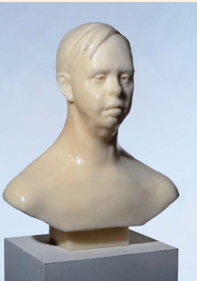
Fred Laforge, Buste trisomique , 2009, Cire, 160 x 151 x 20 cm.