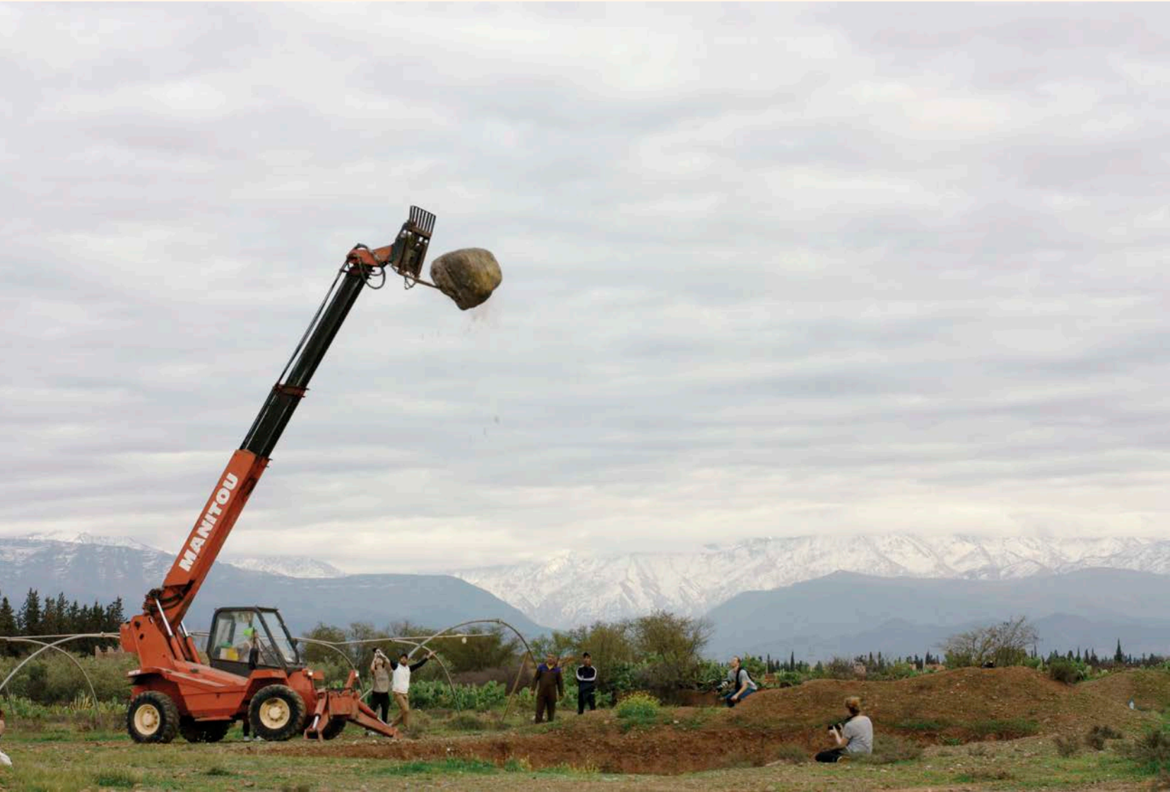
Pages précédentes/Previous pages: Gilles Aubry and Zouheir Atbane , And Who Sees the Mystery , 2014. Installation sonore et vidéo/Sound and video installation, dimensions variables/variable dimensions. Ci-dessus/Above: Anne Duk Hee Jordan , Atlas , performance, Marrakech Biennale, 2014.