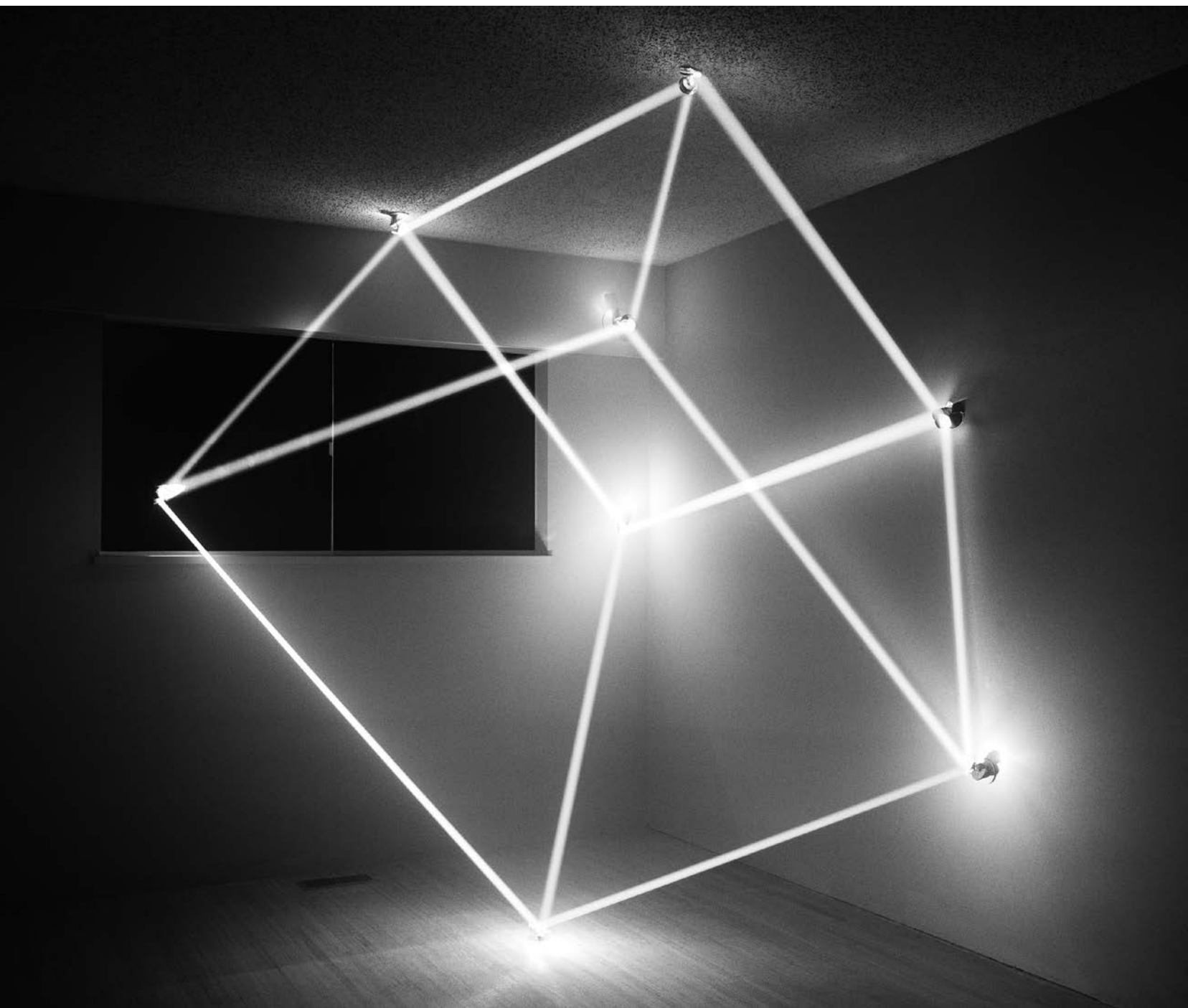
James Nizam , Umbra , 2013.