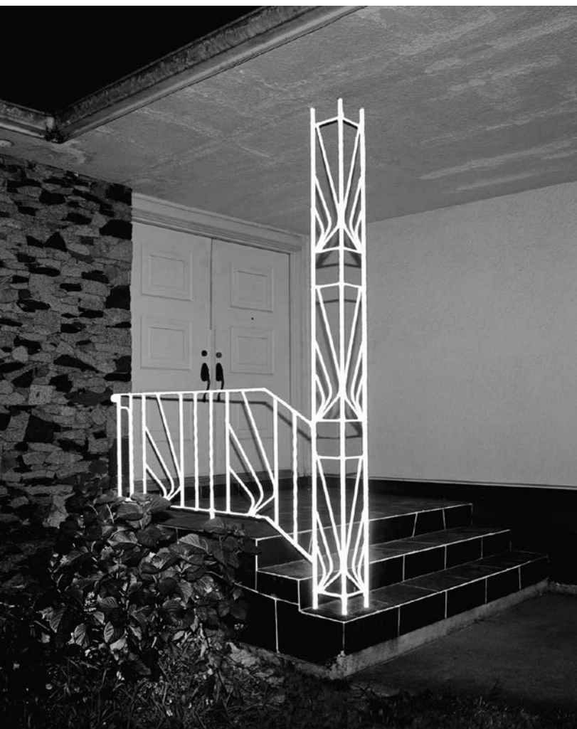
James Nizam, Wrought Iron Railing in Light Reflective Material , 2013.

Je ne souhaite pas être nostalgique et transmettre un sentiment tragique de perte quant au romantisme qui émane des bâtiments abandonnés. Je m'intéresse davantage au potentiel de ces sites, quand ils s'éclairent dans un moment d'effacement. Comme l'écrivait Walter Benjamin : « Il ne faut pas dire que le passé éclaire le présent ou que le présent éclaire le passé. Une image, au contraire, est ce en quoi l'Autrefois rencontre le Maintenant dans un éclair pour former une constellation. »