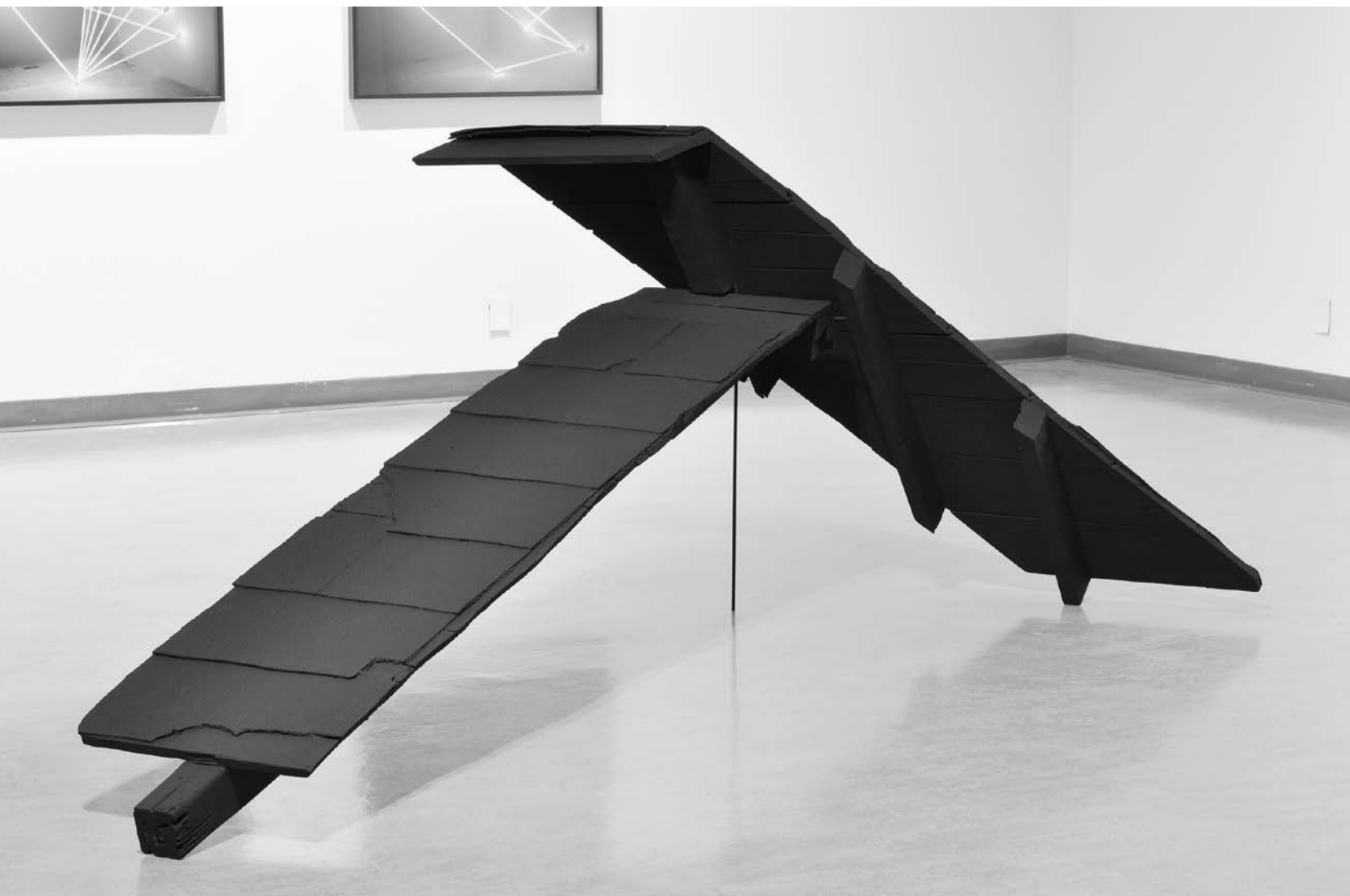
James Nizam , Umbra , 2013.