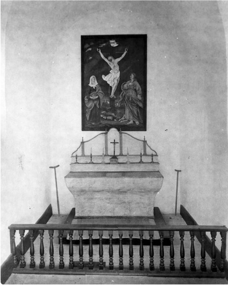
La chapelle du Calvaire d'Oka (John R. Porter)

Certaines rumeurs affirment que ces actes posés au lendemain de la Révolution tranquille n'ont pas nécessairement été animés par un sentiment antireligieux ou anticlérical. Néanmoins, il reste que les graffitis, les découpages à la hache et les crémations de fragments d'images et d'autels que ces stations ont subis, n'auraient pu être possibles ni même pensables durant les décennies et les siècles passés. L'ordre social et le système de