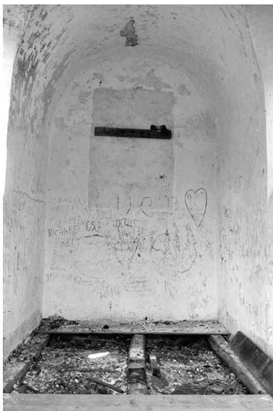
La chapelle du calvaire d'Oka (Edgar Gariépy) Source : Bibliothèque et Archives nationales du Québec