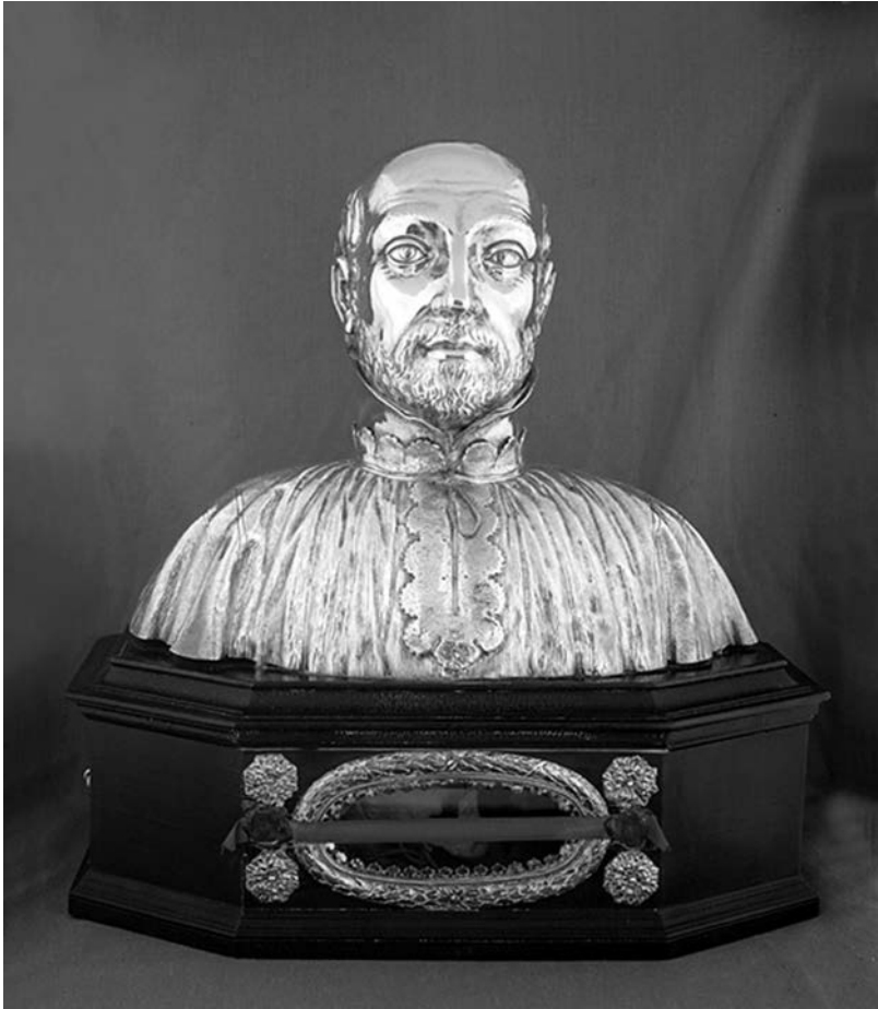
Buste-reliquaire du père Jean de Brébeuf

Le reliquaire du père Brébeuf (fig.3) est un exemple qui démontre toute la complexité d'un objet à la fois ethnologique et esthétique. Fabriqué à Paris par Charles de Poilly 16 en 1664-1665, l'objet a été réalisé en argent et les traits du jésuite sont d'un très grand raffinement. Montré à quelques reprises comme un objet artistique unique au Québec, il reste que le buste est un reliquaire et qu'il demeurera toujours un objet sacré pour les croyants. En 1984, lors de l'exposition Le grand héritage au Musée national des