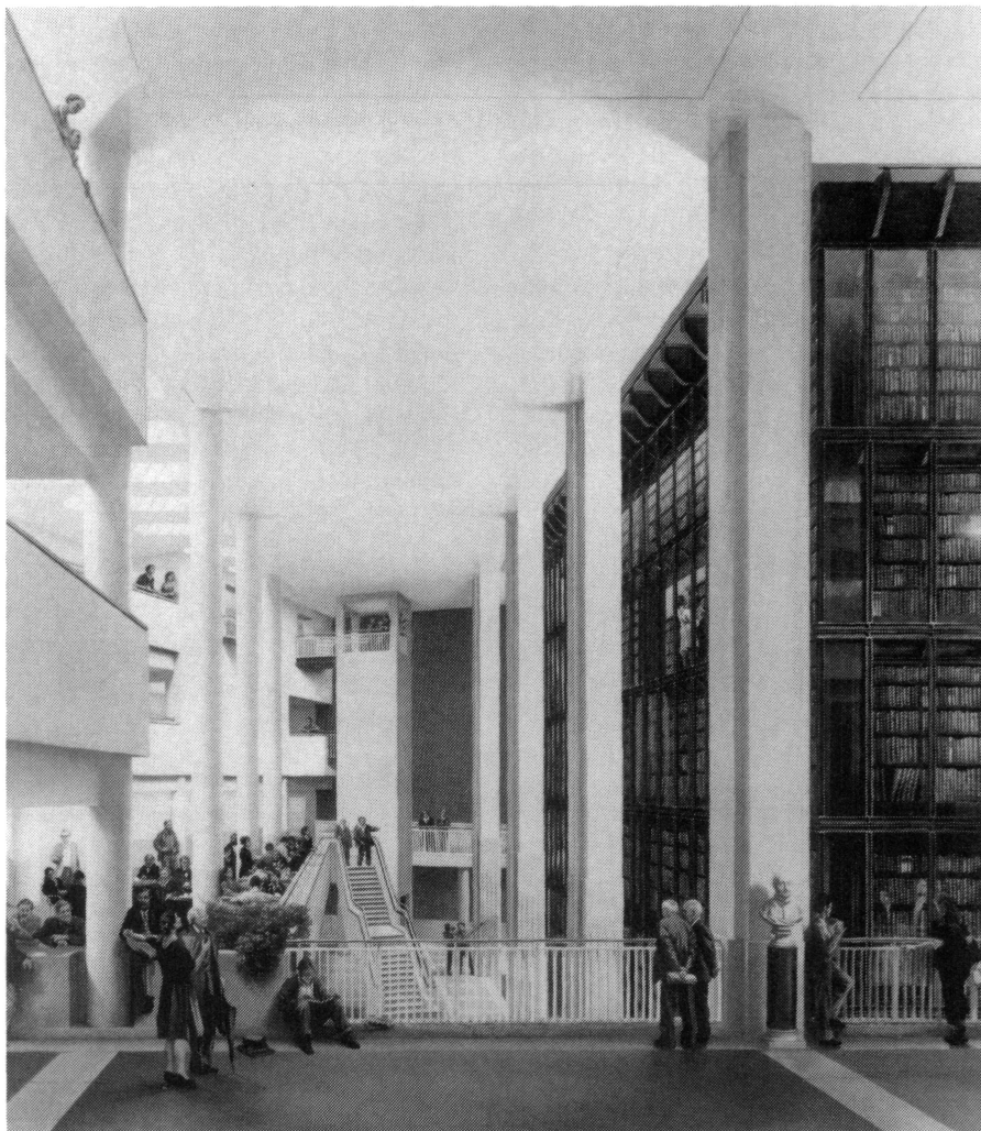
The King's Library. Dessin par C. Laubin

J'ai déjà fait mention des salles de lecture mises à la disposition des lecteurs dans le nouveau bâtiment. On prévoit, en outre, trois galeries pour les expositions permanentes, spéciales et interactives. Un volet particulier à mettre en place pour 1996 est la «bibliothèque royale» de Georges III qui occupera les étagères d'une «bibliothèque» vitrée spéciale sur six étages au milieu du grand hall. Il s'agira là d'un des fleurons esthétiques du nouvel immeuble. Cet aménagement mettra directement les ouvrages à la disposition du lecteur dans un cadre digne de cette collection unique et «royale».