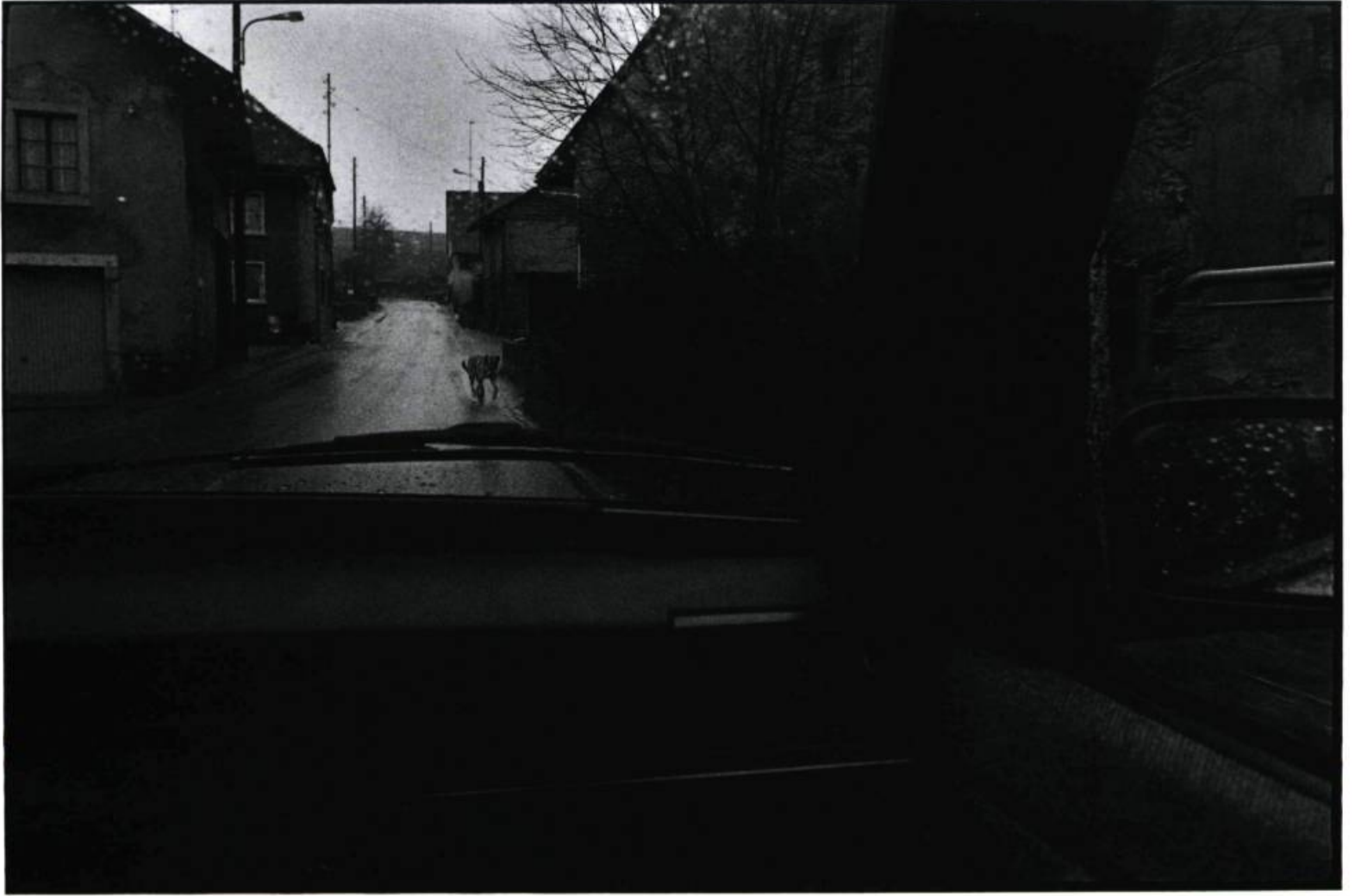
Juras Décembre 1988