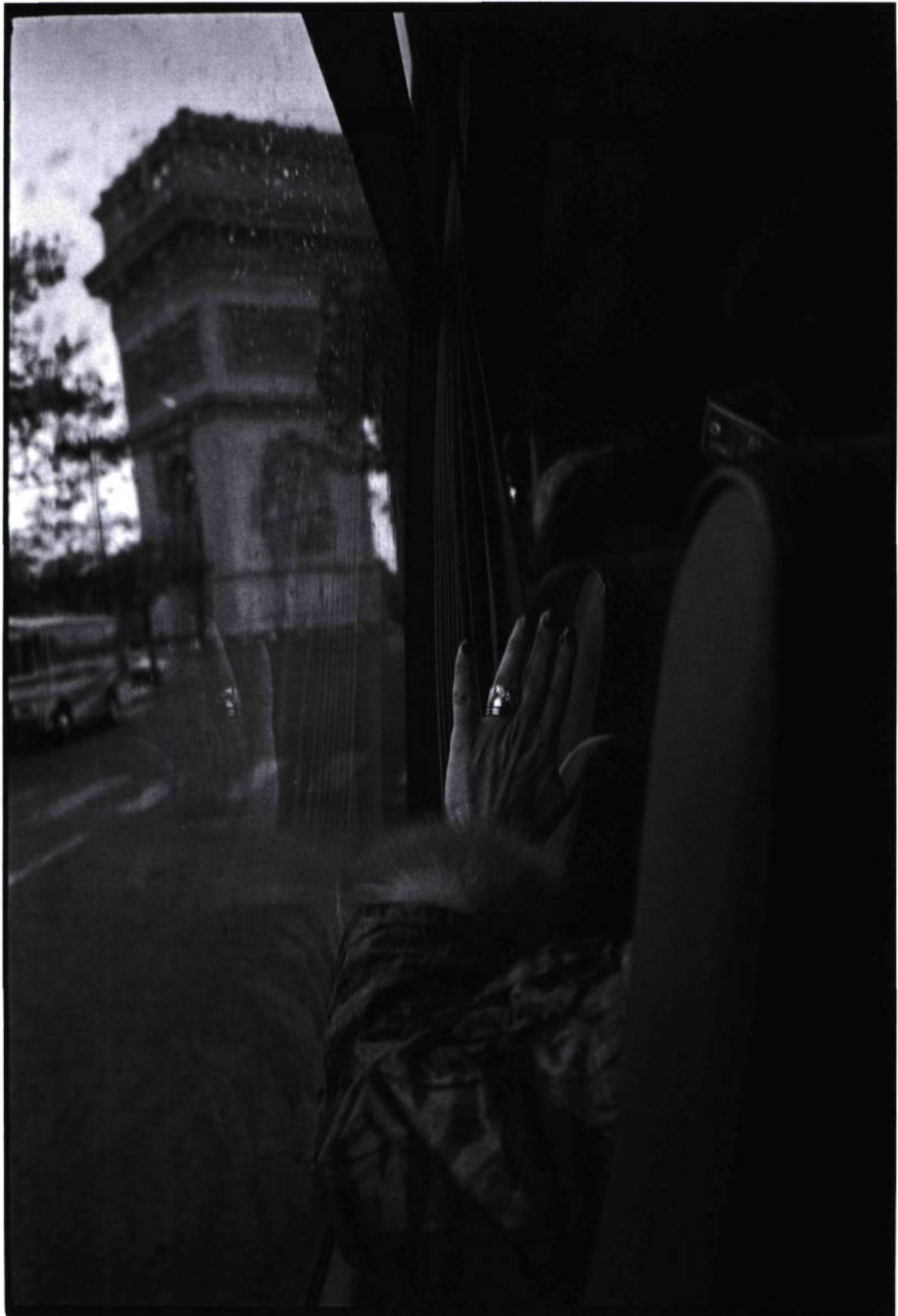
Paris Novembre 1991