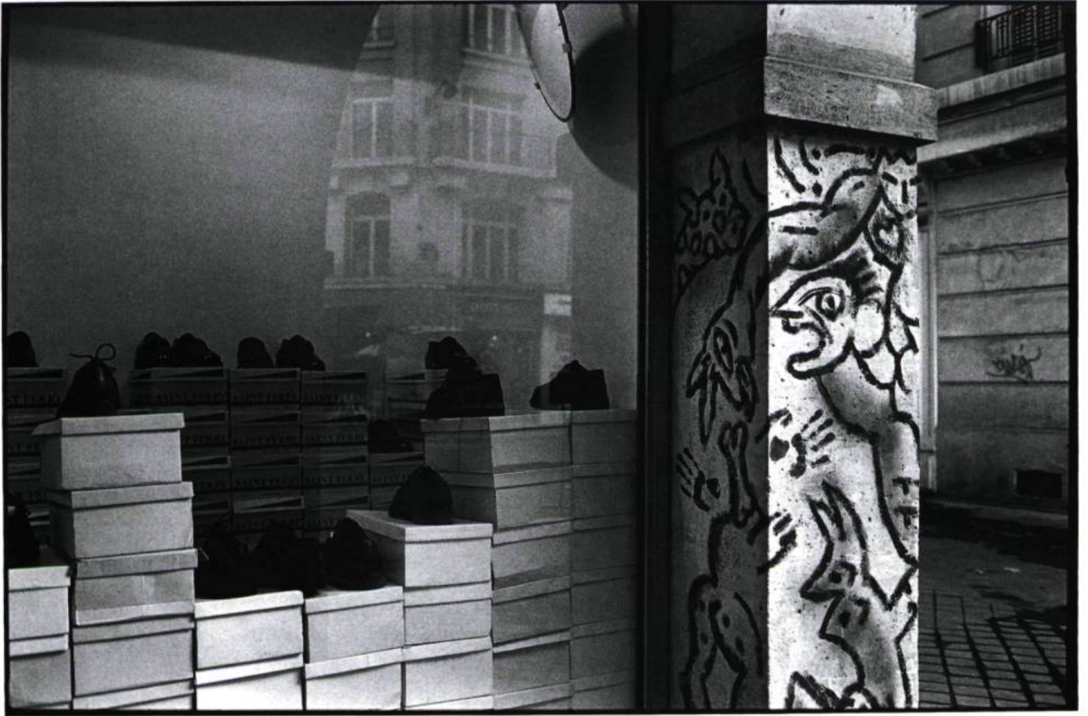
Rue de la Renarde, Paris 1986