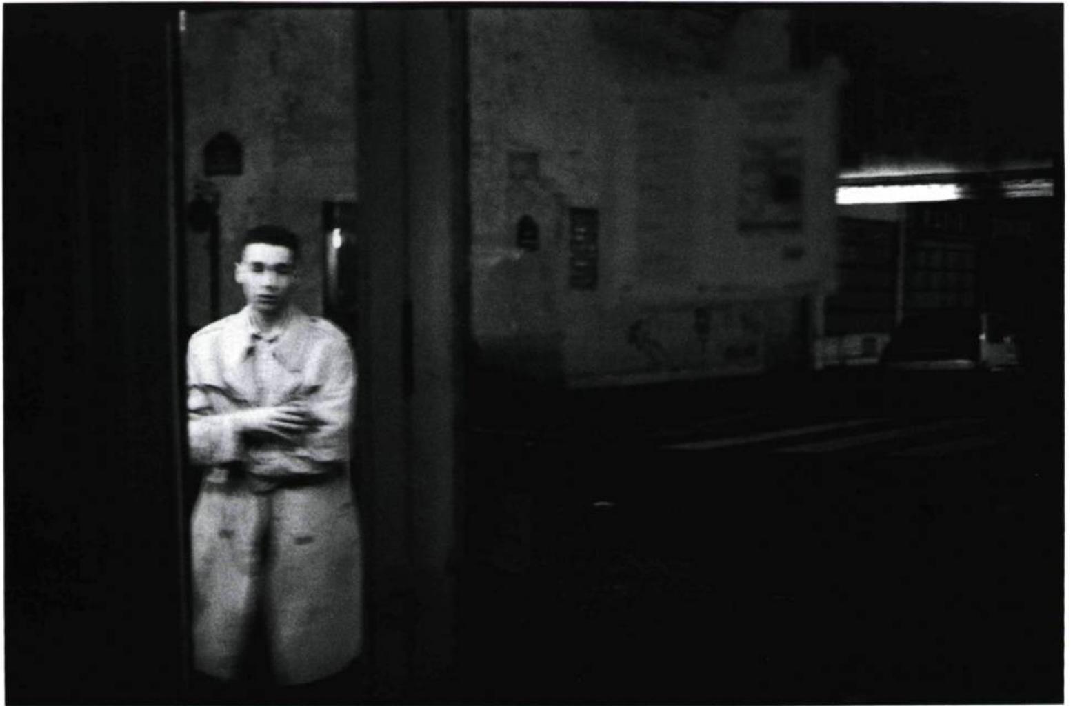
Café de la Place, Paris Mars 1988