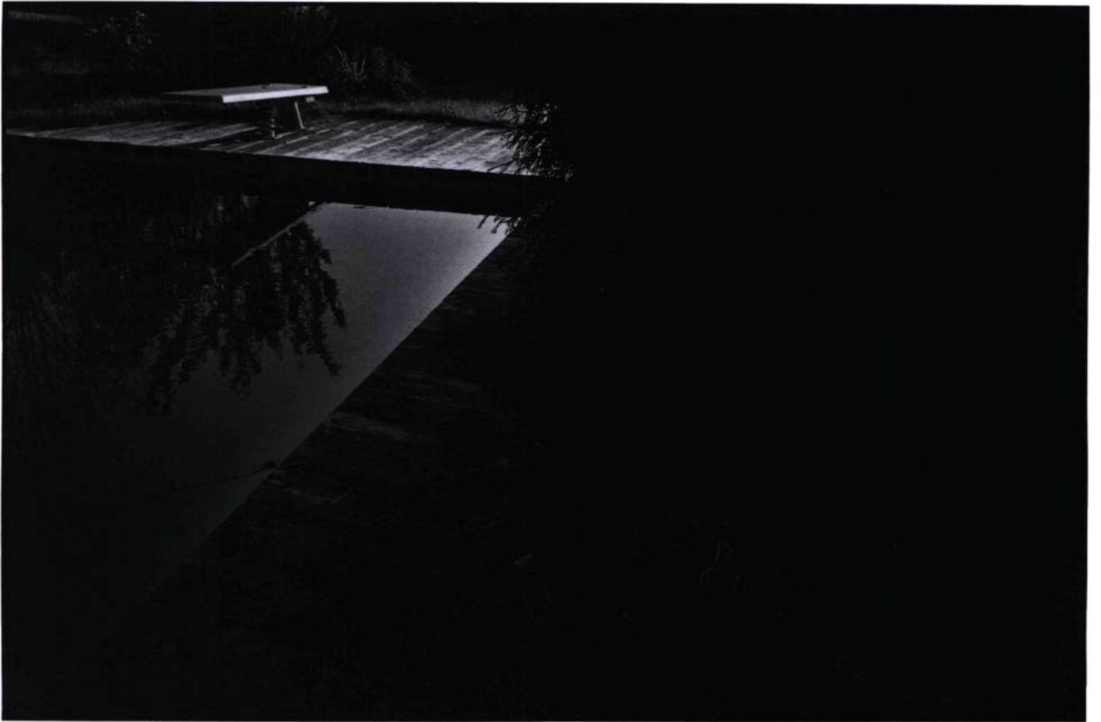
Edrechi, France Novembre 1986