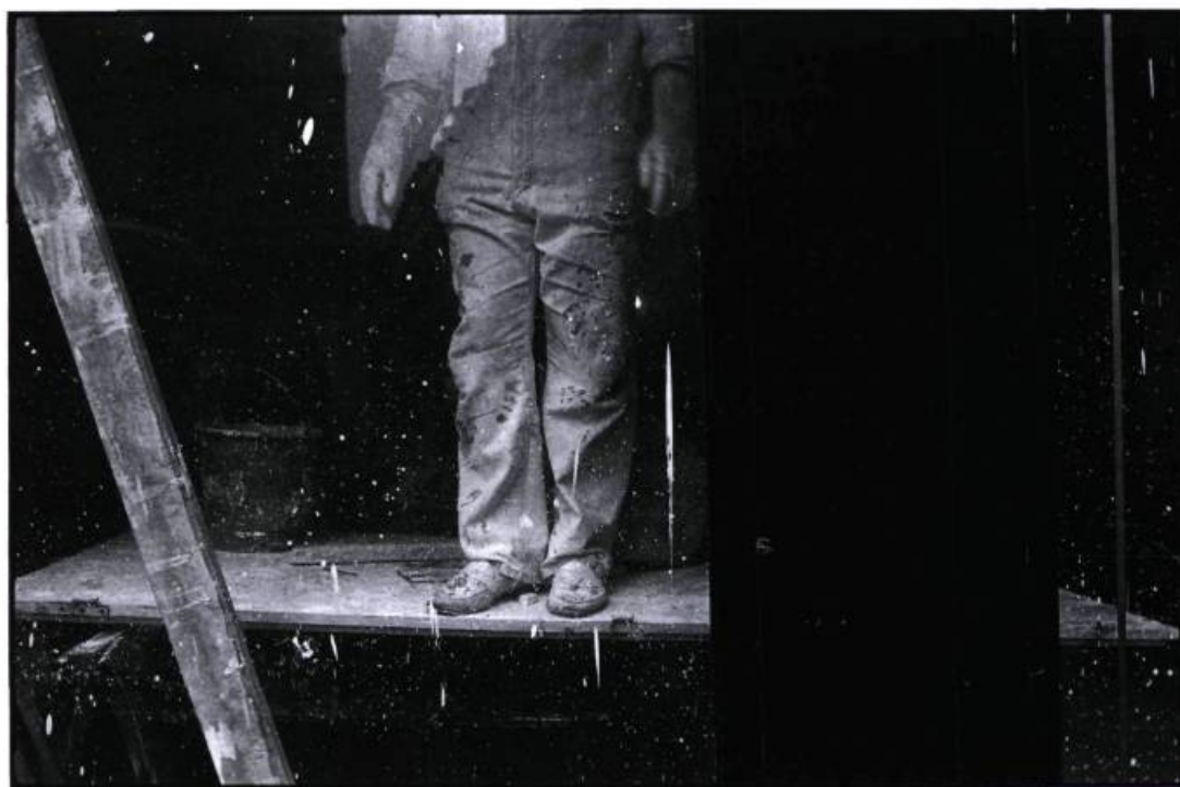
Rue de Turenne, Paris