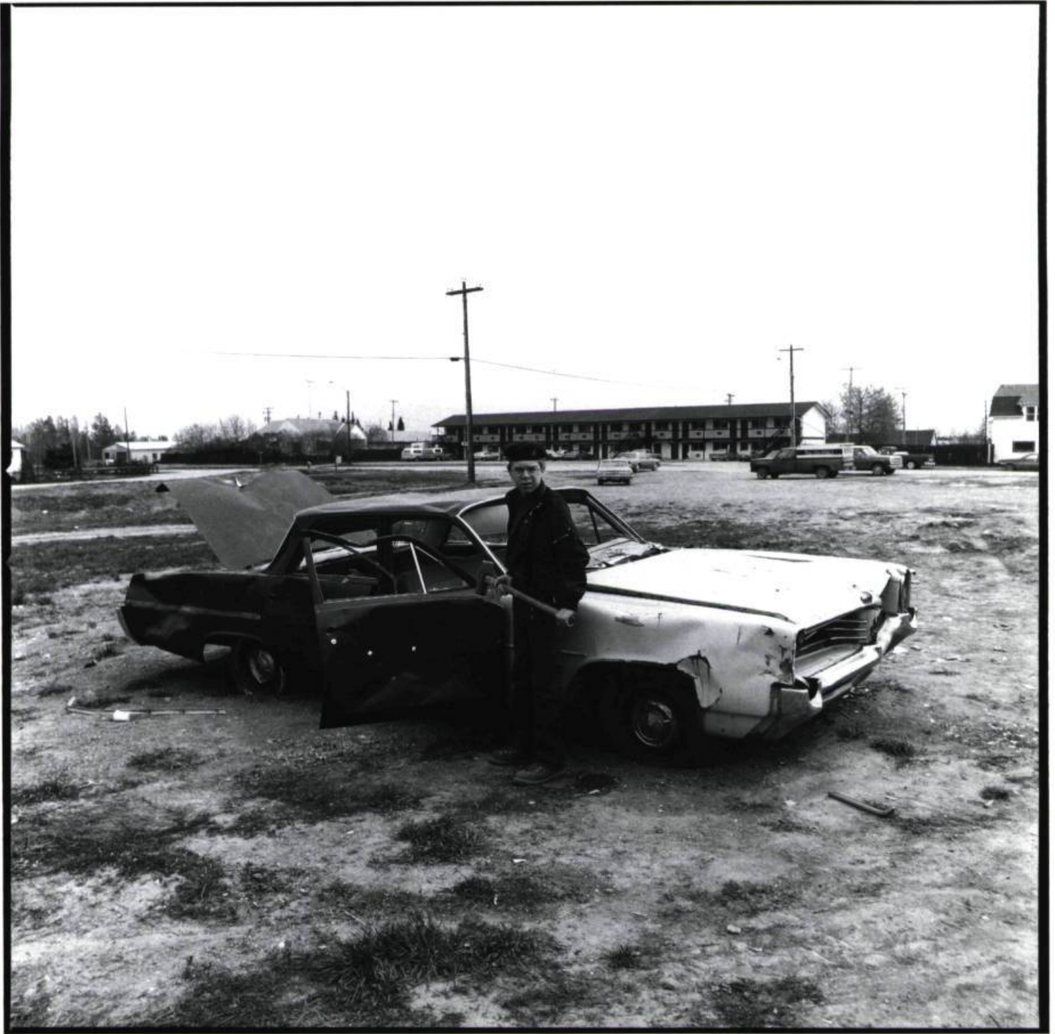
Boy scout, Caroline, Alberta, 1984