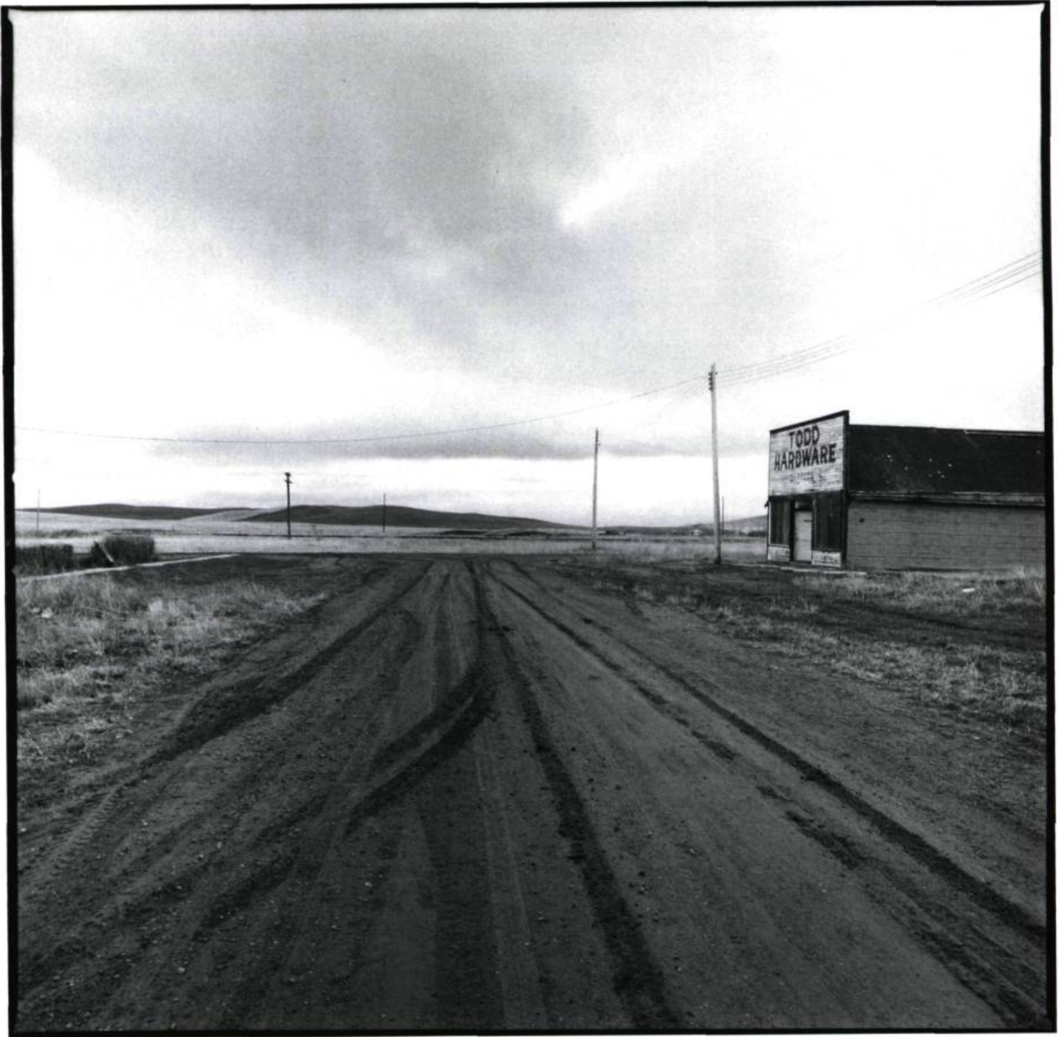
Michichi, Alberta, 1987