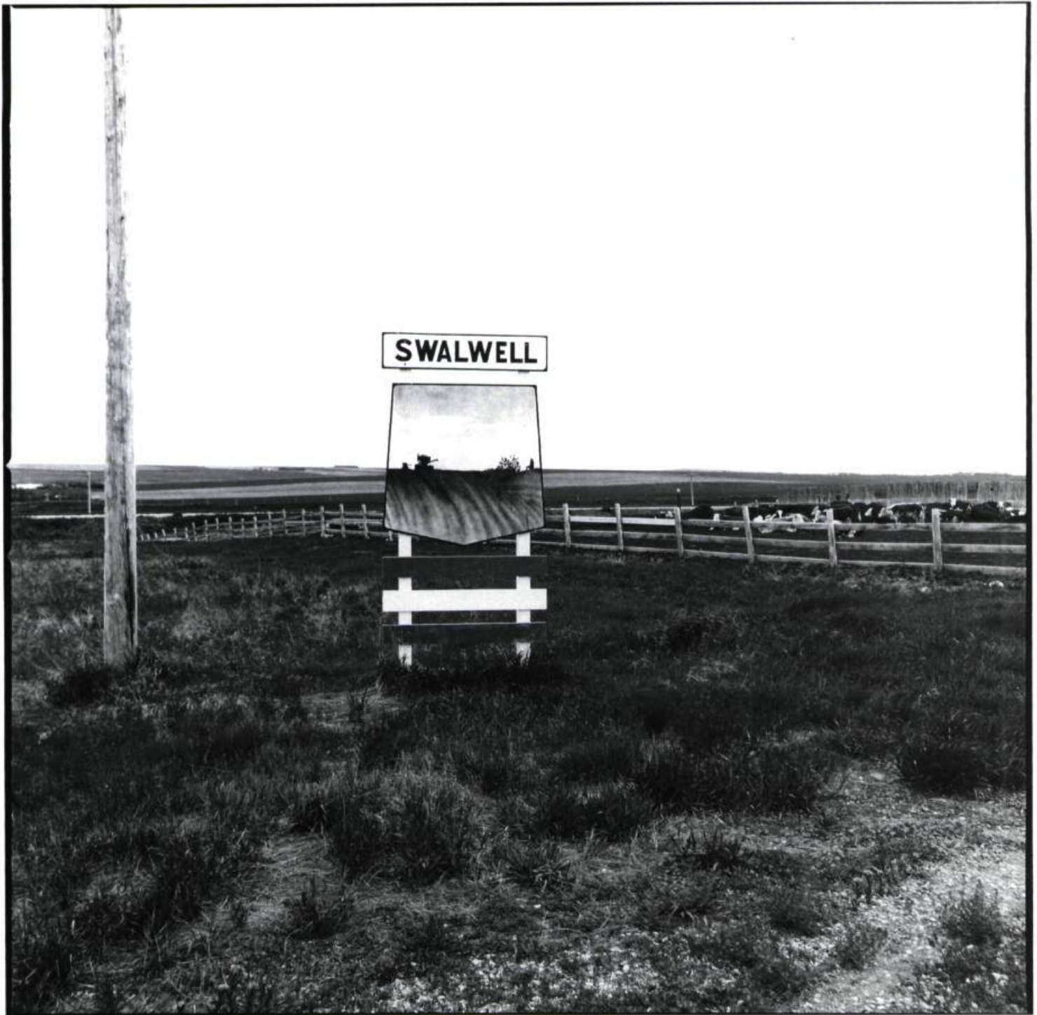
Swalwell, Alberta, 1984