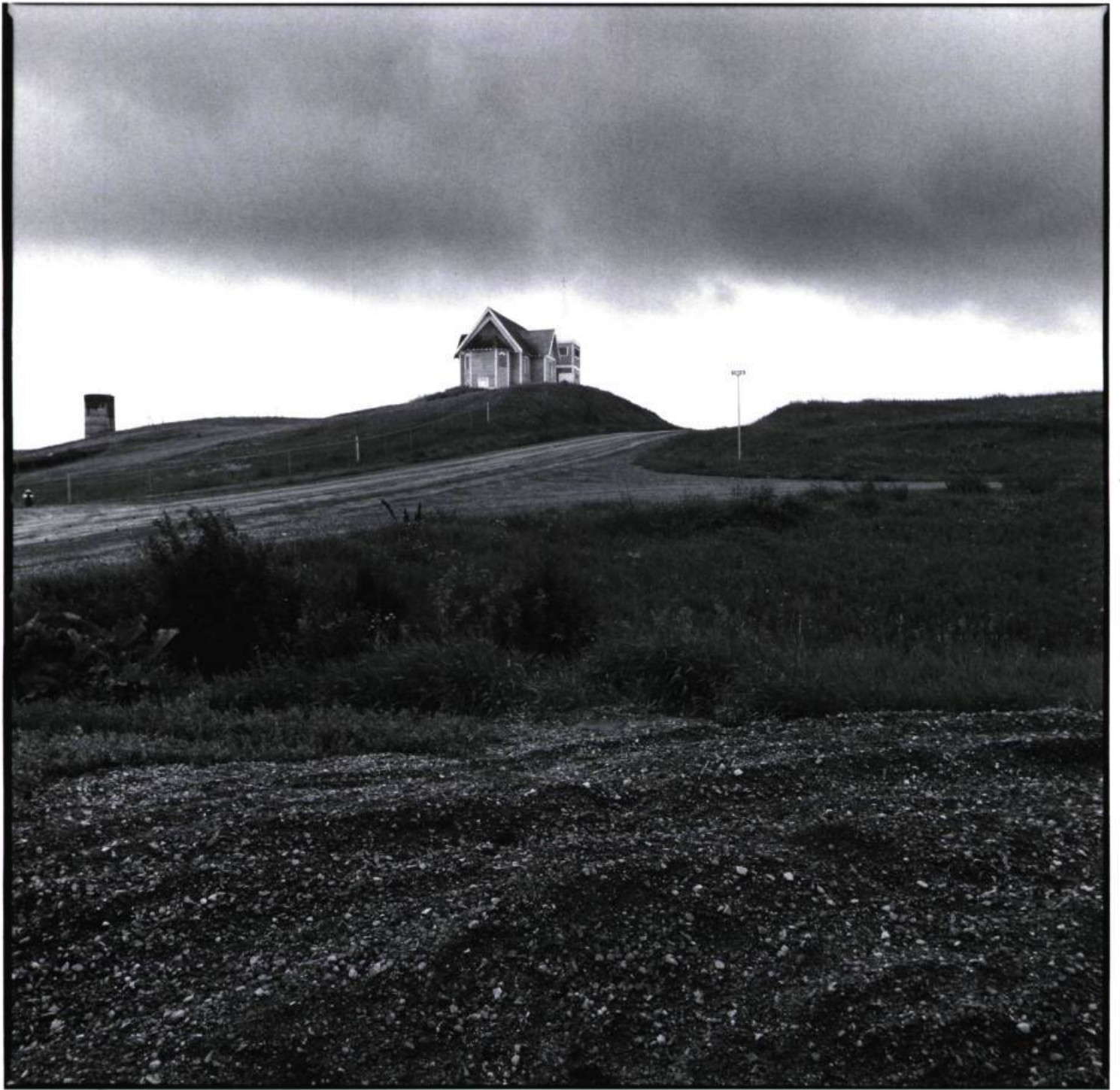
Big Valley, Alberta, 1987