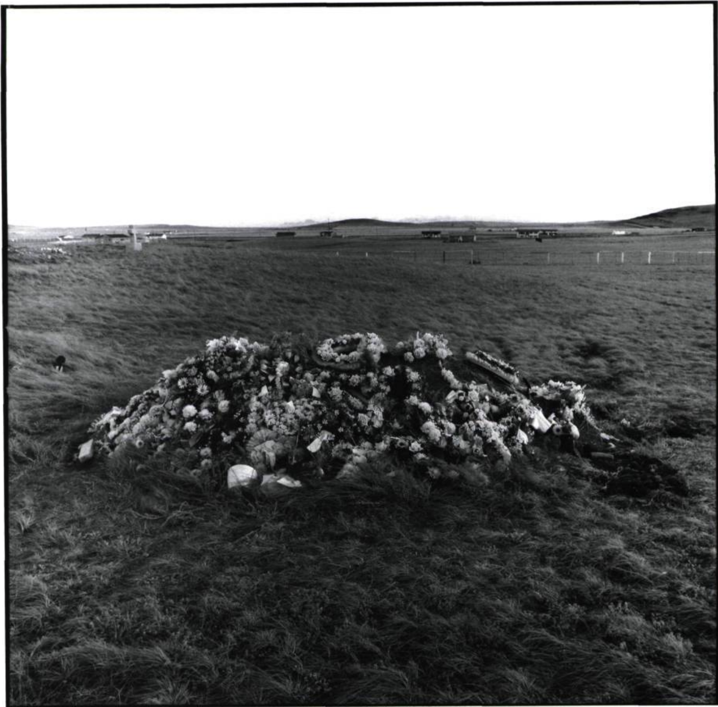
Brocket, Alberta, 1988