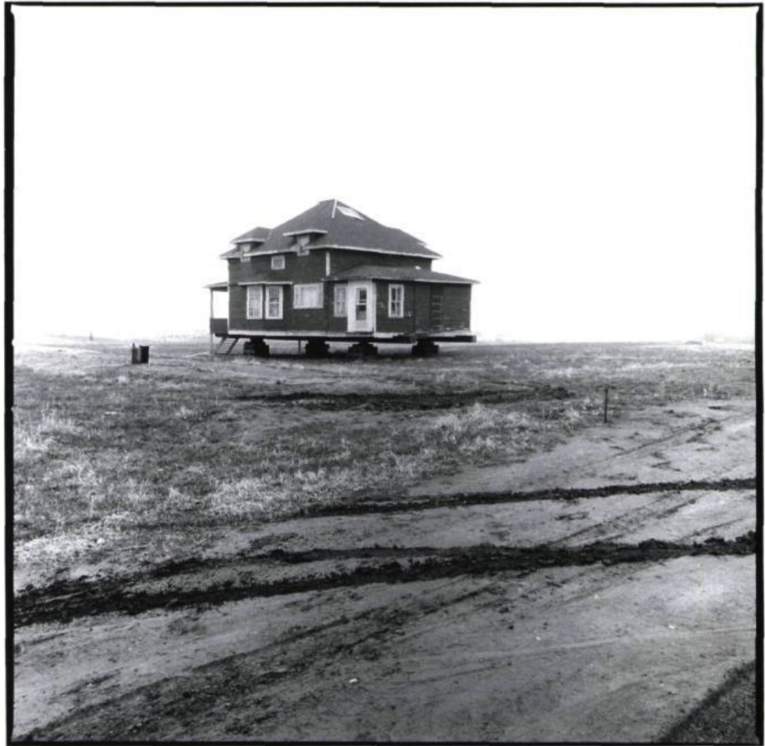
Craigmyle, Alberta, 1987

sous d'envahissantes frondaisons, comme si la végétation s'employait à lentement les dévorer ou à les étrangler; ou reposent sur des blocs, à l'image d'un astronef attendant d'être livré à l'abysse spatial. Seule la moitié d'une gare subsiste le long d'une voie ferrée sur laquelle les trains ne roulent plus. Toutes ces structures, preuves concrètes de la colonisation et des luttes menées par l'homme dans les Prairies, se tiennent dans une tension dynamique entre la terre et le ciel. Les photographies de Webber présentent au plan de la composition un incessant mouvement de va-et-vient entre ces éléments. L'horizon coupe invariablement le cadre en deux : un ciel gris blafard surplombe une terre sombre et froide. Les constructions humaines ne se découpent pas fièrement sur l'étendue du ciel; lorsque cela semble être le cas, elles s'estompent dans la brume. Ces structures sont généralement en train de tomber en ruine et de lentement s'enfoncer dans la masse humide, sombre et brutale de la terre. Ce n'est pas un hasard si l'unique bâtiment apparaissant sur le seul horizon élevé, les contours nettement dessinés sur le ciel, est une église.