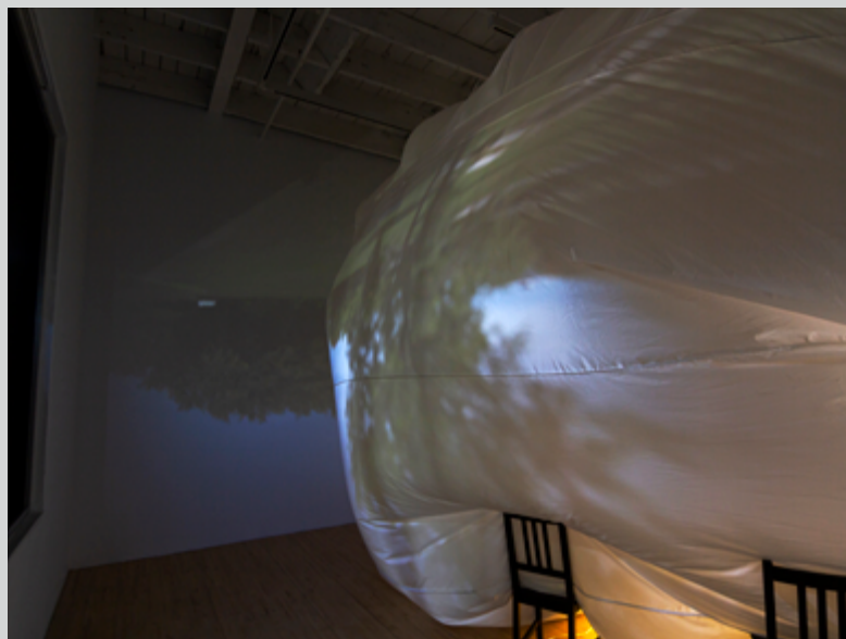
Alexis Bellavance, Compressions : tables préparées (détail), 2019

À l'automne 2019, Axenéo7 présentait dans ses espaces les expositions Quelque part dans l'inachevé de Sarah Wendt et Pascal Dufaux, ainsi que Compressions : tables préparées d'Alexis Bellavance. Ayant au premier coup d'œil peu en commun, les propositions de ces artistes montréalais se rejoignent toutefois autour du principe d'une temporalité transformatrice agissant sur la perception, et de son ancrage dans ce qu'il convient d'appeler le réel.