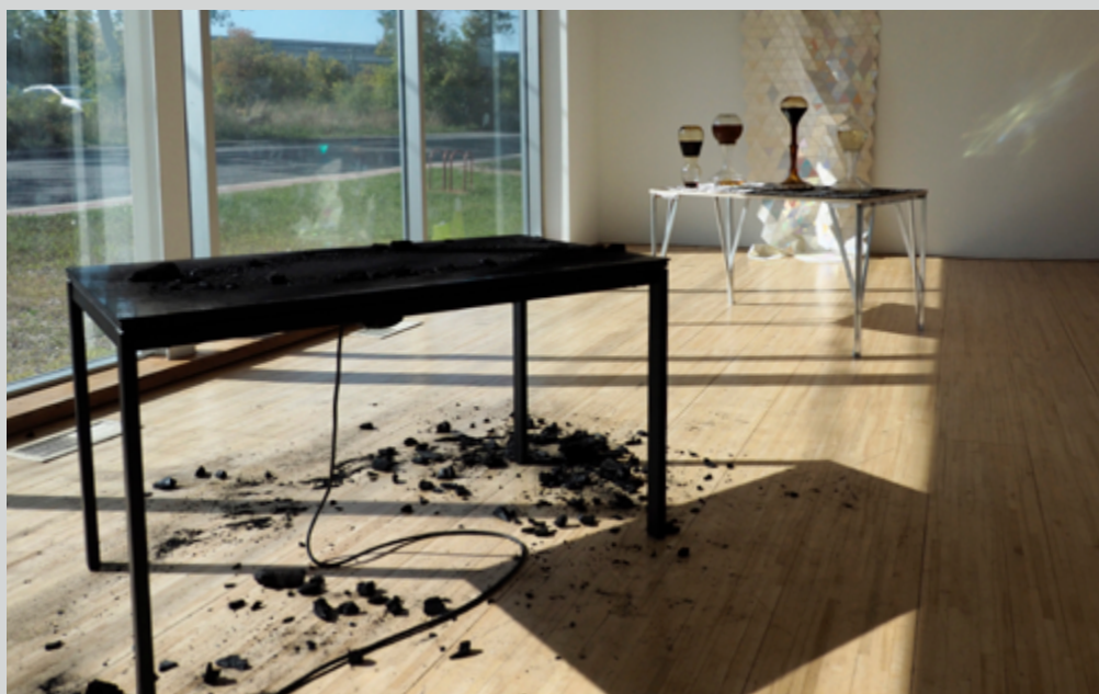
Au premier plan : Alexis Bellavance, Table préparée n° 2 (détail), 2019, en arrière-plan : Sarah Wendt & Pascal Dufaux, Sabliers de miel (détail), 2019

photographies – des écrits de lumière. Être au cœur de la camera obscura , c’est devenir le témoin privilégié de l’origine d’une image. C’est être du côté de sa fabrication, de son arrivée et de sa présence au monde. C’est observer l’image avant même qu’elle n’existe : être l’œil au seuil du visible. Le phénomène optique qui a cours ici est précisément ce qui se produit à l’intérieur du dispositif