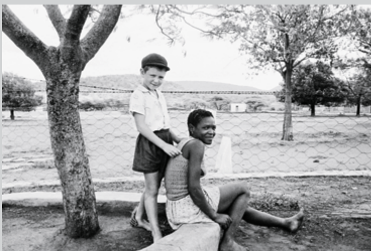
David Goldblatt, A Farmer's Son with his Nursemaid, Heimweberg, Nietverdiend, Western Transvaal , from the series Some Afrikaners Photographed , 1964 (printed 2010), gelatin silver print, courtesy of Goodman Gallery, Johannesburg