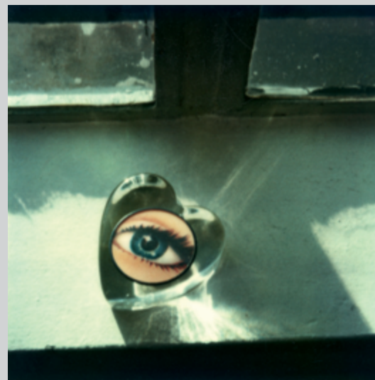
Paolo Gioli, Questo volto non è il mio volto (This Face Is Not My Face) , 2010