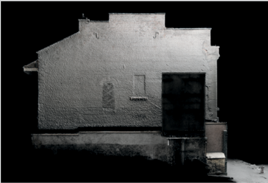
Gagnon-Forest, 77 Saint-Antoine, de la série Une archive imparfaite , 2019, impression n et b, 50 x 75 cm

en 2016. La présence minuscule d'êtres humains admirant la vue parmi les troncs dégarnis de montagnes noyées dans les nuages, ou sur le point de se baigner comme si de rien n'était sur les rives dévastées d'un cours d'eau sinueux, paraît adapter l'esthétique du paysage chinois, accentuant l'infini de la nature, au pressentiment écologique de sa plus ou moins résiliente finitude.