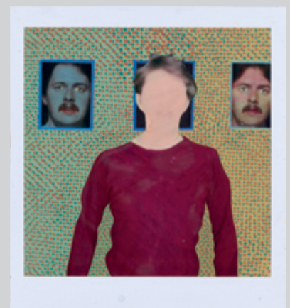
Ellen Carey, Pulls (CMY) , 1997, © Joyne H. Baum Gallery, New York et M+B Gallery, Los Angeles