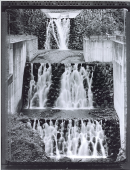
Toshio Shibata, Untitled (#228) , 2003