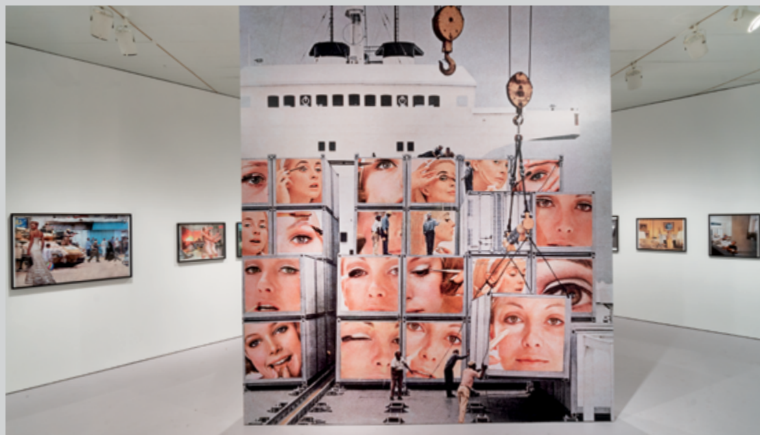
Martha Rosler: Irrespective, vue de l'exposition au Jewish Museum de New York

Rosler a également superposé la liste d'une centaine de personnes faisant partie de minorités visibles tuées par des policiers dans la rue ou pendant leur détention provisoire. C'est donc sur une ultime dénonciation des inégalités sociales que le parcours de cette exposition poignante, provocante, et dont toutes les œuvres demeurent d'actualité, se terminait. Un appel, donc, à la prise de parole et à un continu engagement politique et social, ainsi qu'à la nécessité de la circulation des œuvres de Martha Rosler dans les différentes sphères de la vie.