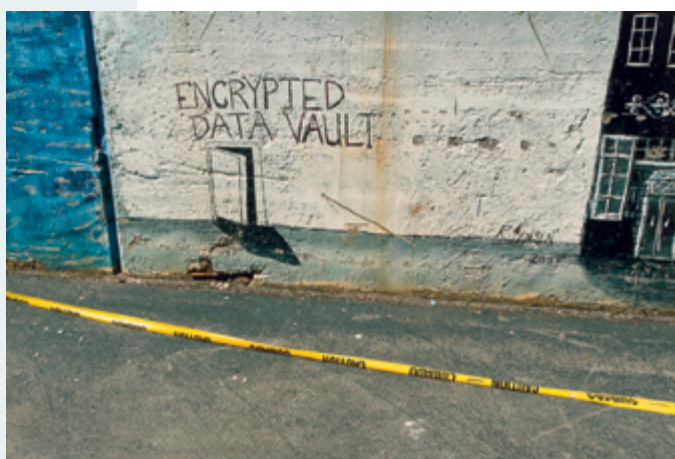
Untitled (New York City), 2016, impression jet d'encre / inkjet print