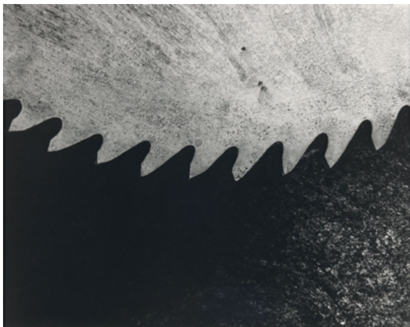
Untitled , 1957, épreuve argentique / gelatin silver print