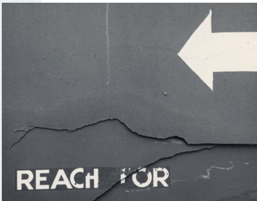
Untitled, 1957, épreuve argentique / gelatin silver print

Plus de deux ans après le décès de Nathan Lyons, survenu le 30 août 2016, In Pursuit of Magic au George Eastman Museum (GEM) propose un aperçu de l'œuvre photographique d'une des figures les plus marquantes de la photographie américaine du XX e siècle 1 . Par sa conception entamée en collaboration avec le photographe en 2013, l'exposition didactique et déroutante oscille entre rétrospective et présentation de travaux récents en couleur.