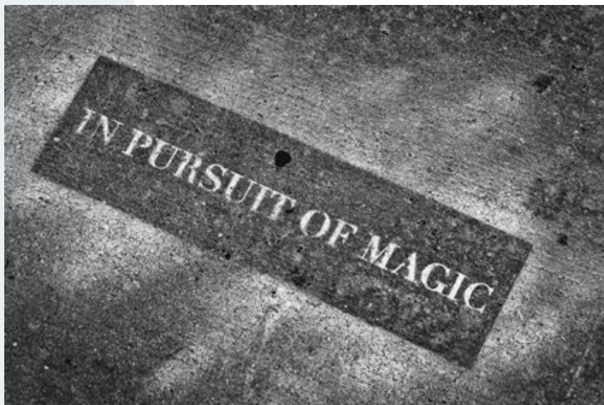
Untitled (New York City), 2013, impression jet d'encre / inkjet print