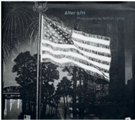
After 9/11, New Haven (Connecticut) Yale University Press, 2003, 176 pages, 152 photographies en noir et blanc / 152 black-and-white photographs Untitled, du livre / from the book After 9/11, 2001-2002 épreuves argentique / gelatin silver prints