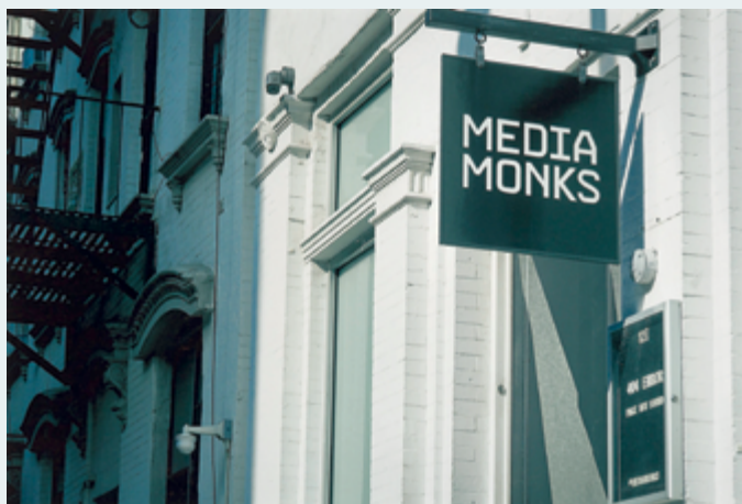
Untitled (Philadelphia), 2015, impression jet d'encre / inkjet print