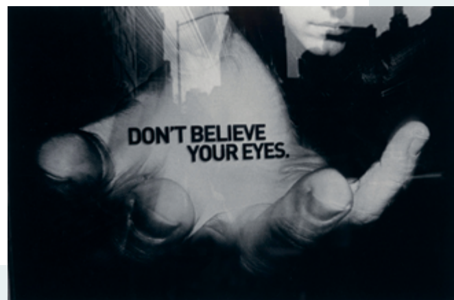
Untitled , 1959, épreuve argentique / gelatin silver print, acquisition du George Eastman Museum / George Eastman Museum purchase, permission de la succession de Nathan Lyons / courtesy of the estate of Nathan Lyons