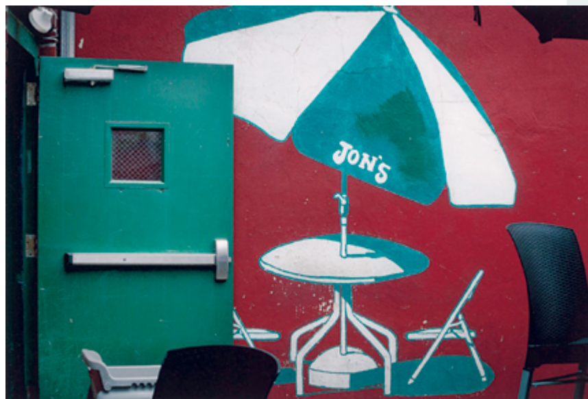
Untitled (Rochester, New York), 2014, impression jet d'encre / inkjet print