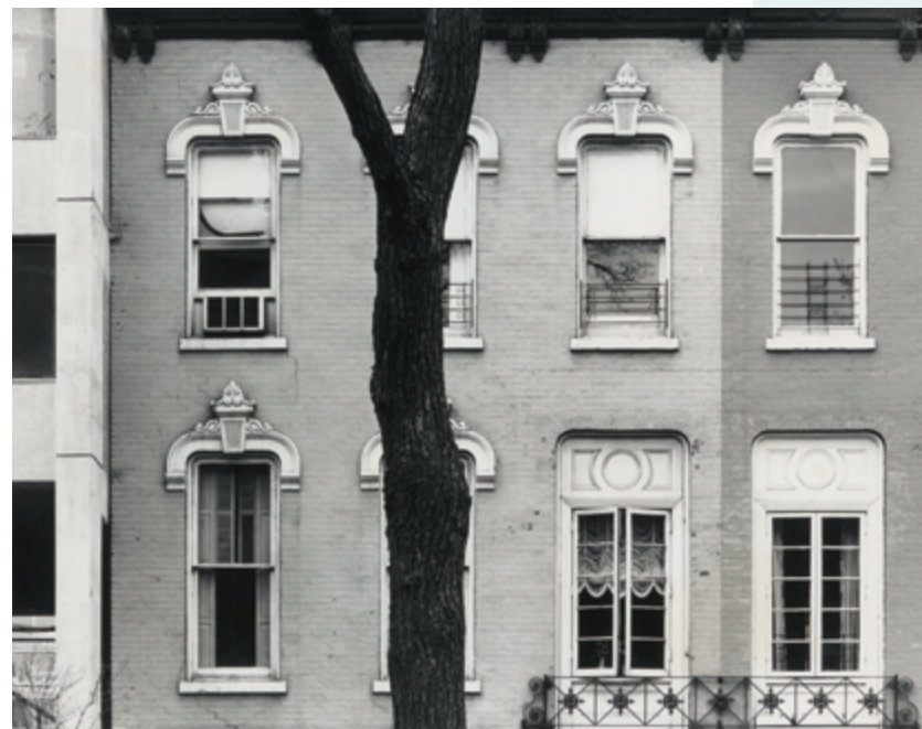
Untitled (Chicago) , 1963, épreuve argentique / gelatin silver print

Le livre Les Américains de Robert Frank a un impact considérable sur la photographie de Nathan Lyons. Publié en France par Delpire, en 1958, puis l'année suivante, par Grove Press aux États-Unis avec, pour introduction, un texte de Jack Kerouac, The Americans