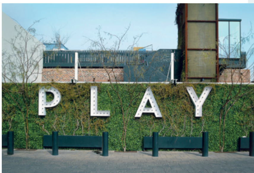
Untitled (Tucson), 2013, impressions jet d'encre / inkjet prints