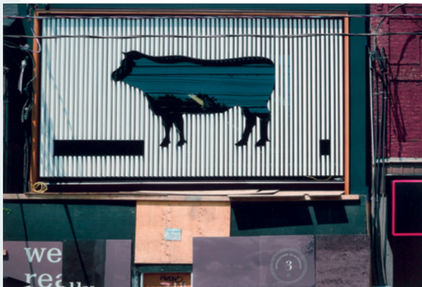
Untitled (Toronto) , 2014, impression jet d'encre / inkjet print

During the first stage of conception of the exhibition (2013–16), when he was experimenting with digital colour photography, Lyons was in his eighties and underwent life-threatening health crises. It seems that he did not have the time to acquire the necessary control and mastery of the new medium that he had discussed in 2007. The prints displayed at the GEM therefore show a lack of technical control, ranging from colour saturation to white balance, that affected his work with both camera and printer. Several prints are dominated by a blue tint, among them the one, In Pursuit of Magic , from which the title of the exhibition was taken. Some colours, especially the greens, shout out of their frames, reminding the visitor