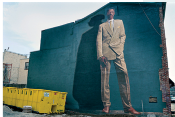
Untitled (Philadelphia) , 2010, impression jet d'encre / inkjet print Untitled (Philadelphia) , 2015, impression jet d'encre / inkjet print