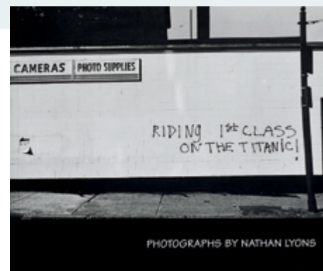
Untitled, du livre / from the book Riding First Class on the Titanic 1974–1998, épreuves argentique / gelatin silver prints

Riding First Class on the Titanic , Cambridge (Massachusetts) MIT Press, 2000, 233 pages