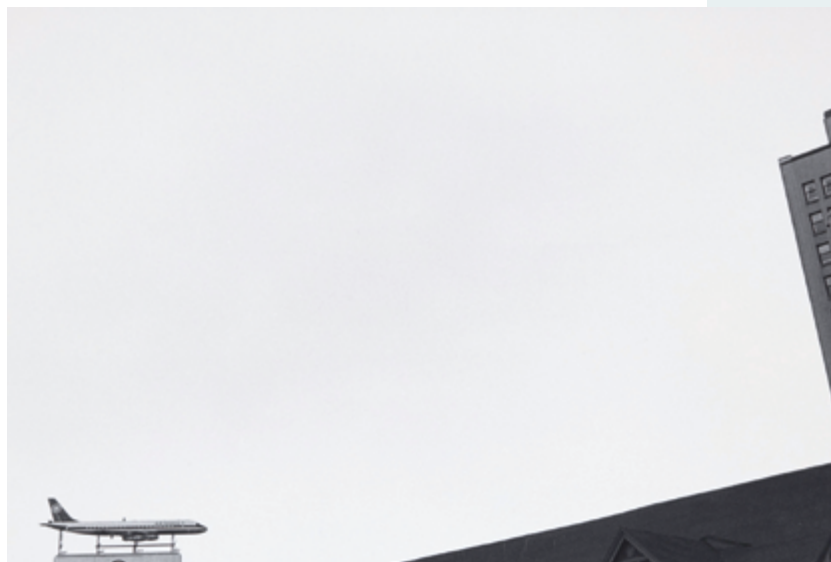
Untitled from Notations in Passing , 1963–2013, impression jet d'encre / inkjet print

L'exposition du GEM rend hommage à ces étapes de l'œuvre du photographe en montrant une sélection des images de ces