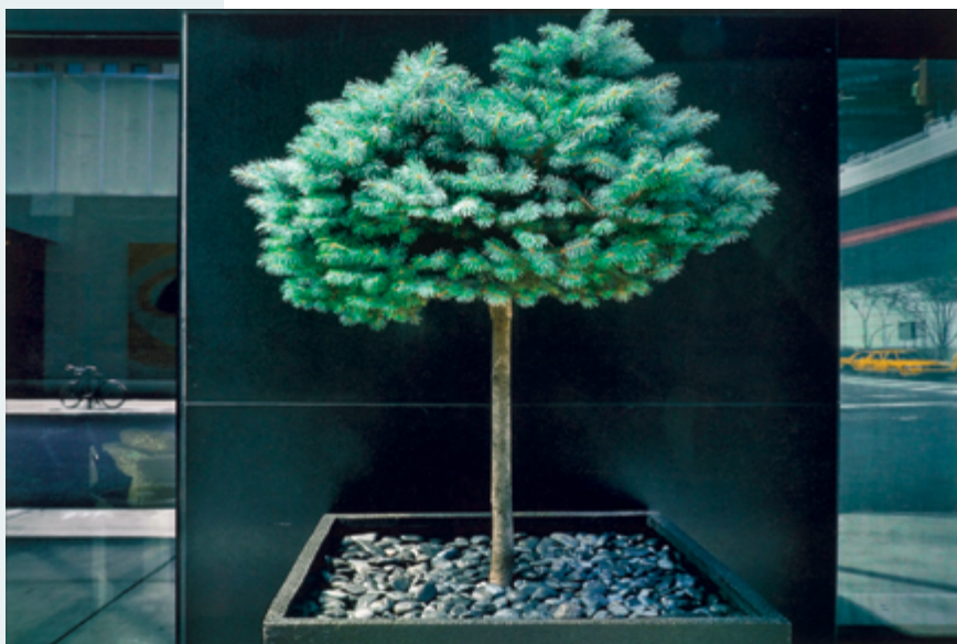
Untitled (New York City) , 2013, impression jet d'encre / inkjet print