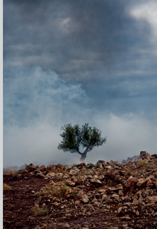
Valerian Mazataud, Zaatari, Jordanie, le 29 septembre 2012 , inkjet print, 61 × 76 cm

out of Cormac McCarthy's The Road : the grey road that leads to the plant, flanked by leafless trees and dead grasses, looks forlorn and abandoned. The mute sky lends the scene a sense of utter hopelessness and anomie. Here, the altered landscape of the Real is mensurably inflected by co-intensive psychic perturbations in the interior landscape. Petrolia is particularly interesting in that it reflects the artist's stratified thinking; at the same time as he elucidates the decommissioning or scaling back of petrochemical processing in Chemical Valley, he offers sundry pastoral landscape views and images of cottage-industry petroleum