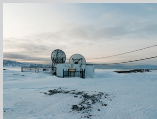
Thomas Kneubühler, Hello world , 2012, digital print, 38 × 50 cm

concerns. Other large-scale photographs expand on what Rutkauskas calls "a dense social landscape" from the periphery of Chemical Valley in which First Nations ceremonial sites, abandoned industry, and environmental-responsibility initiatives all meaningfully collide.