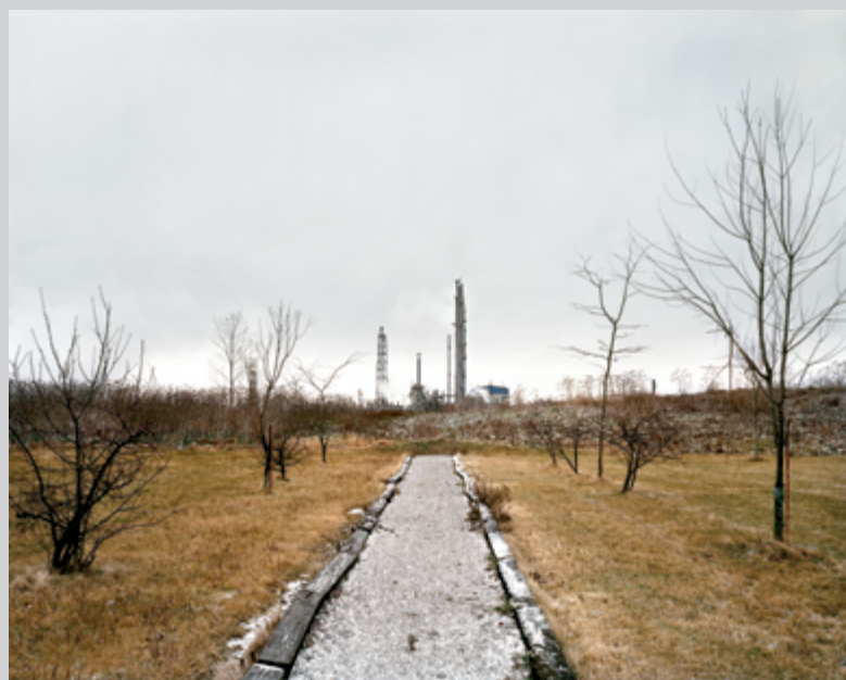
Andreas Rutkauskas, Park and Nitrogen Fertilizer , 2011, digital print, 102 × 127 cm

Andreas Rutkauskas seizes on landscapes that have been affected by technology and examines them with bold clarity and a certain athletic agility. In Park and nitrogen fertilizer plant from his series Petrolia , we have a desolate glimpse of what seems a post-apocalyptic environment straight