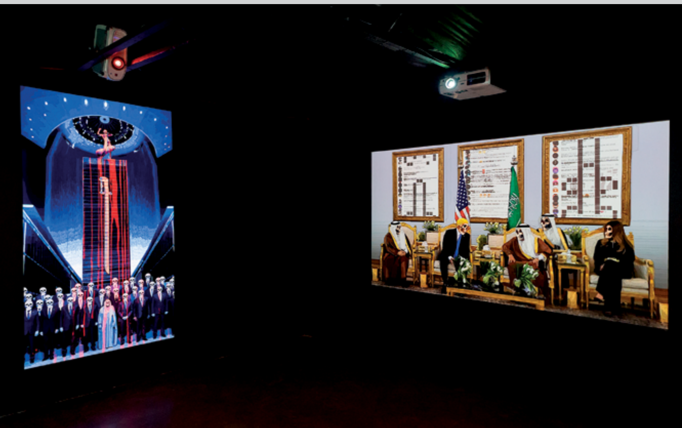
Boris Firquet, Mascarades

éclatés de l'image fixe et en mouvement. S'y intègrent également d'autres disciplines qui dialoguent parfois de près avec l'image, parfois de plus loin, telles que la performance sonore (Magali Babin, GGRIL), la danse, la musique, les marionnettes.